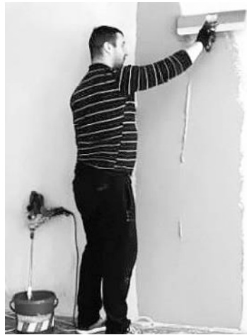
оценимый труд, и пусть у них всё будет хорошо.