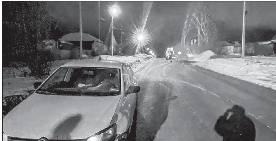
Пешеход остался чудом жив после ДТП с двумя автомобилями. При наличии тротуара молодой человек шёл по проезжей части

Сотрудники Госавтоинспекции напоминают пешеходам, что передвигаться можно только по тротуарам, пешеходным дорожкам, а при их отсутствии – по обочинам. Если вы идёте по краю проезжей части, то идти