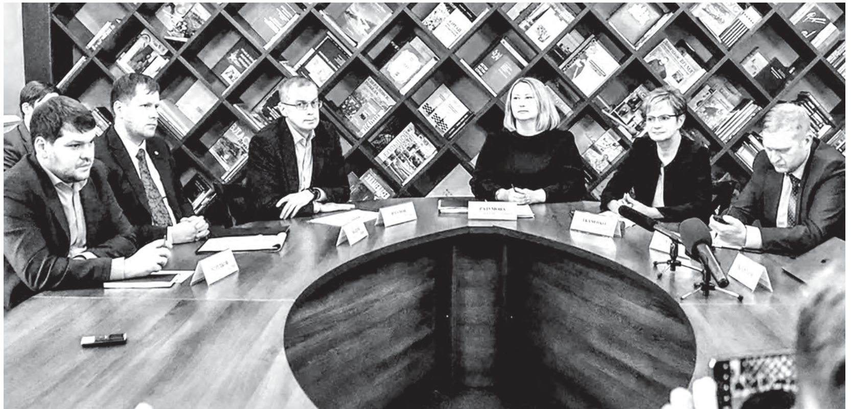
26 января в Доме журналистов собрались представители шести организаций, чтобы ответить на вопросы, связанные с изменением тарифа на электроэнергию в Свердловской области

Эксперты посоветовали уральцам не спешить перепрограммировать приборы учёта электроэнергии