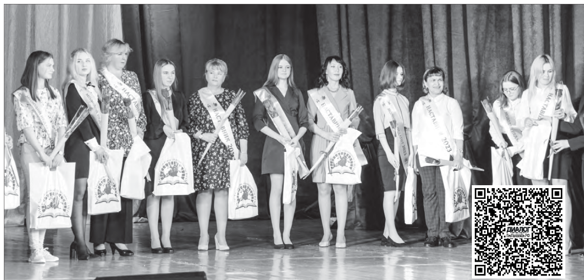
В ходе мероприятия на сцену пригласили молодых специалистов и их наставников

В Полевском Год педагога и наставника стартовал 28 января. Торжественное откры-