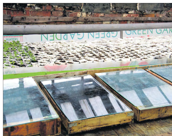
Некоторые культуры уже посеяли, а первые всходы рассады томатов уже радуют глаз