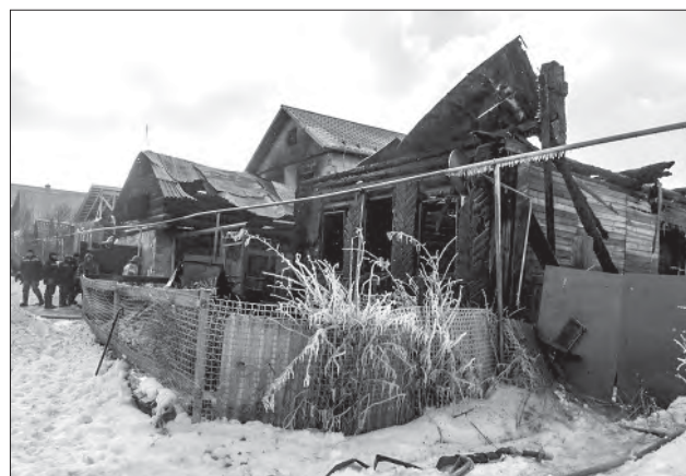
Из горящего дома бабушка и взрослые внуки выбрались через окно

Так же утром, в 5.36, 29 января произошёл пожар в частном сек-