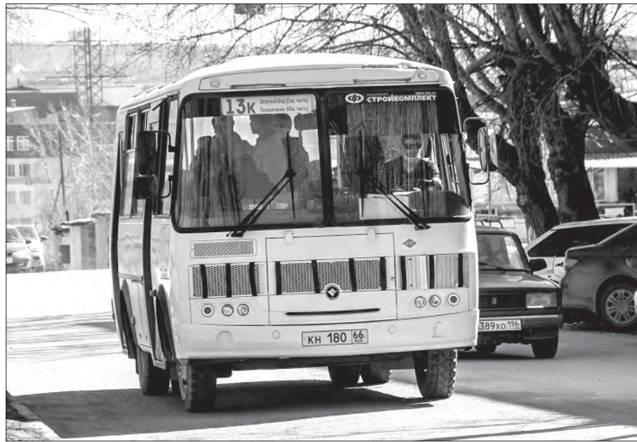
Основные изменения коснутся маршрутов №12 и 13

Вполне вероятно, к концу этого года общественный транспорт в Полевском пойдёт по-другому