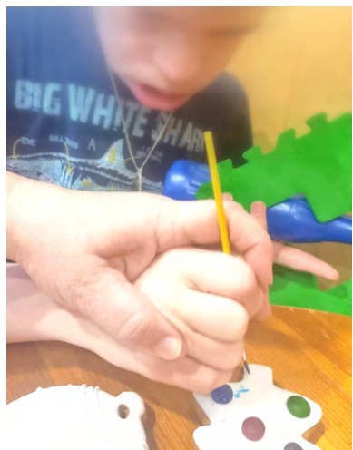
ФОТО: «Я могу! Я есть! Я буду!»

Всё это станет доступно особенным детям Заречного благодаря проекту «МастерОк», который реализуют при поддержке Фонда президентских грантов.