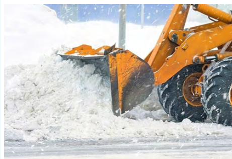
ГРАФИК УБОРКИ СНЕГА С ДВОРОВЫХ ТЕРРИТОРИЙ

* Для информации: - уборка дворов продолжается один день, возможно продолжение уборки на второй день, но уже дополнительными силами, без нарушения графика.