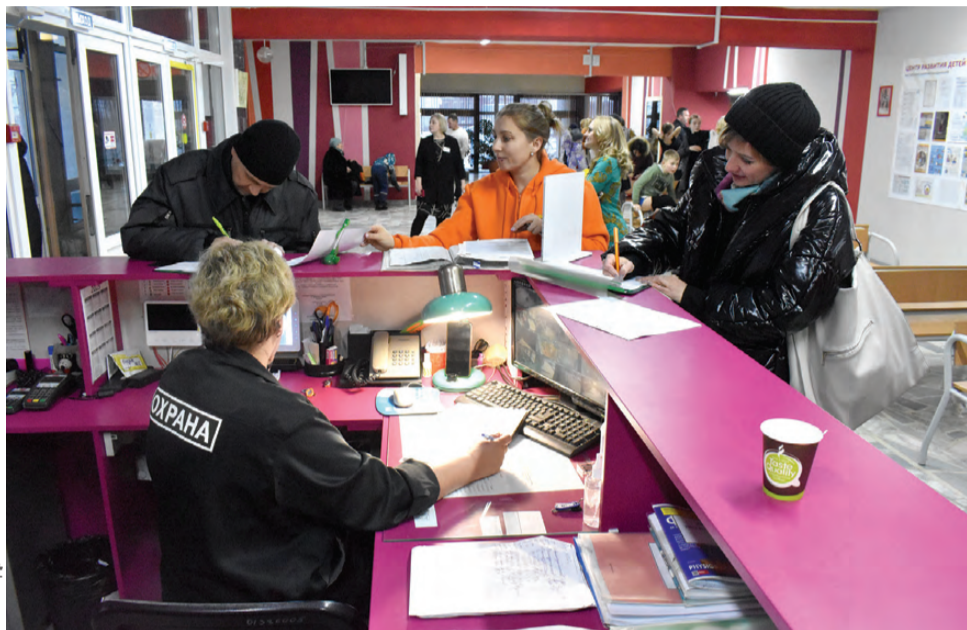
Общественное обсуждение начинается с регистрации и заполнения анкеты

Две карты, пачка фломастеров и лист с условными обозначениями — первоуральцы определяли будущий облик набережной Нижнего пруда, отмечая сильные и слабые стороны территории. Официально говоря, составляли техническое задание на разработку концепции благоустройства одного из любимых мест отдыха горожан. Вместе с одной из команд чертила велодорожку, обозначала зону тихого отдыха, размещала лебедей у причала лодочной станции и «Вечерка».