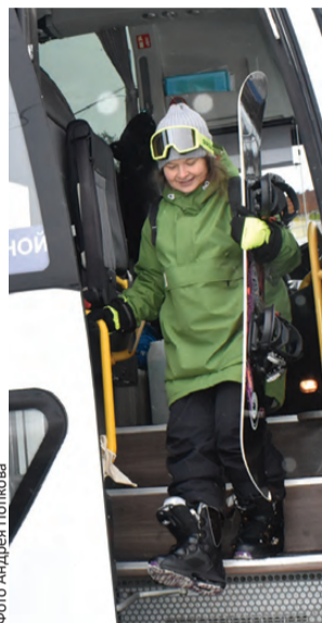
Приехали: лыжники, на выход!

В Первоуральске в черте города размещаются три горнолыжных комплекса: туристический потенциал огромный! И сейчас он начинает реализовываться в полной мере. Ранее добраться на общественном транспорте до горнолыжных комплексов, помимо разве что «Пильной», было проблематично. А потому по инициативе жителей 21 января, как известно, администрация Первоуральска открыла два бесплатных автобусных маршрута, объединяющих все три горнолыжных комплекса Первоуральска.