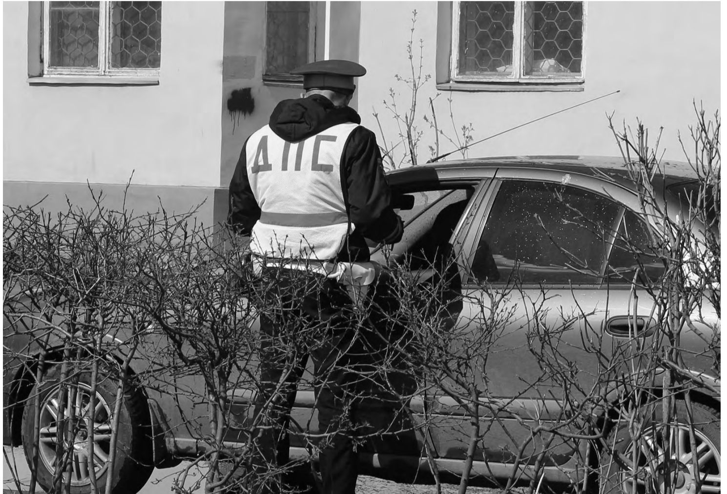
Для выявления неплательщиков регулярно проводятся оперативно-профилактические мероприятия «Должник»

А еще в течение года нужно не попасться на глаза сотрудникам ГИБДД, которые неплательщиков активно выявляют.