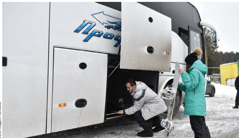
Для лыж и сноубордов в автобусе – вместительное багажное отделение