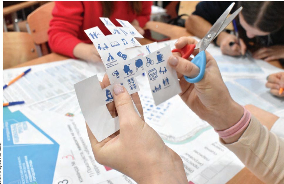
«Так, сейчас пристроим еще один элемент благоустройства!»