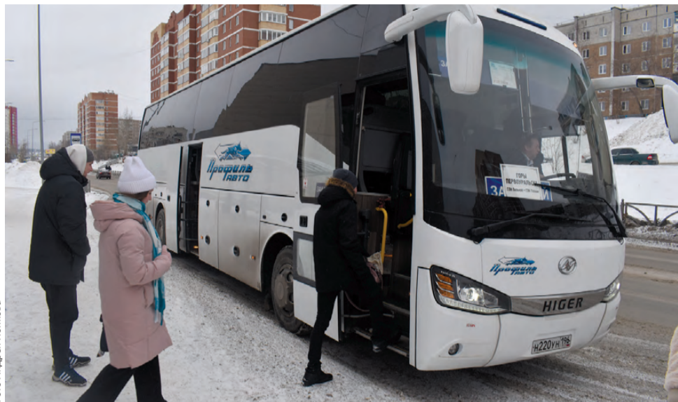
Остановка на Береговой: едем на «Гору Теплую»

За первые две субботы работы нового бесплатного маршрута по горнолыжным комплексам Первоуральска: «Гора Теплая», «Гора Волчиха» и «Пильная парк» пассажирами автобусов стали около 100 человек. Среди них не только первоуральцы, но и жители Екатеринбурга.