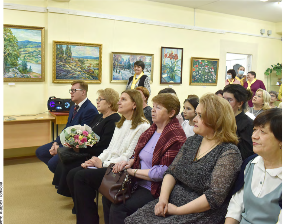
«Живой звук» – это вдохновение души