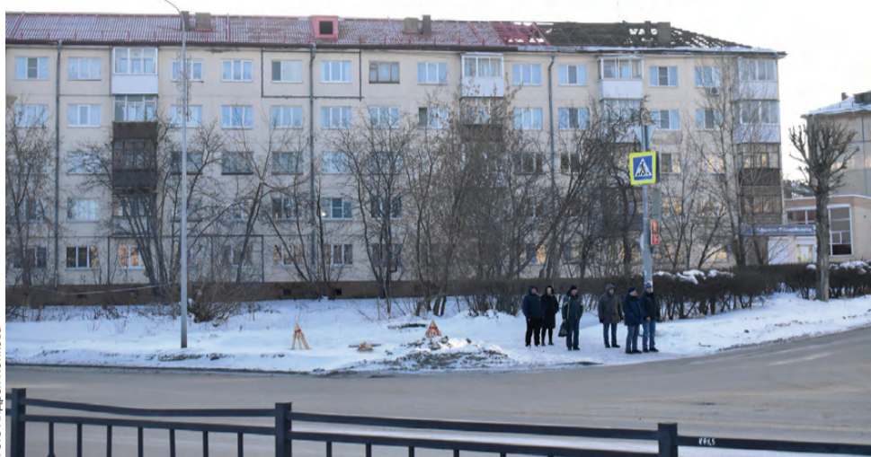
На проспекте Ильича капитально отремонтируют пять домов

В Первоуральске стартует очередная кампания по капитальному ремонту многоквартирных домов. В этом году работы запланированы в восемнадцати.