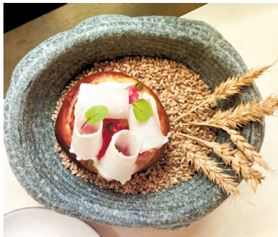
Шангу из ржаной муки с печеным картофелем, копченым сыром, хренодером, черемшой и одуванчиковым медом подавали на теплом зерне, чтобы не остыла.

Условно москвича все эти гастрономические события, возможно, и не заставят купить билет в Екатеринбург. У наших же земляков появится больше поводов отправиться в путешествие за новыми вкусами.