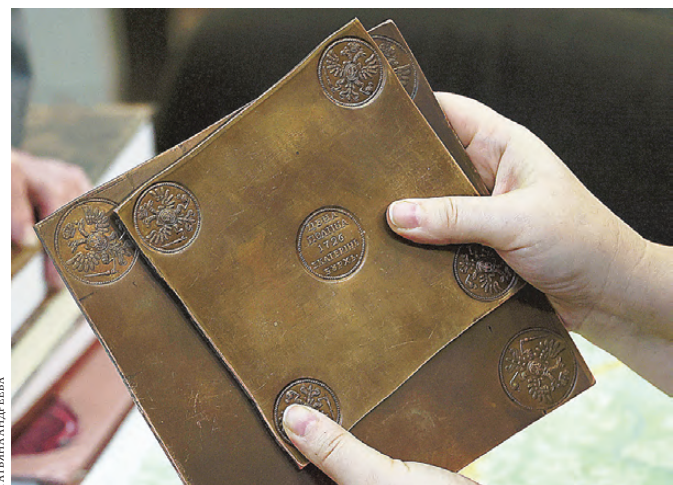
Медная плата — предшественница монеты. Ее стоимость обеспечивал вес металла.

Дизайн купюр только что созданного СССР разрабатывал уралец Иван Шадр