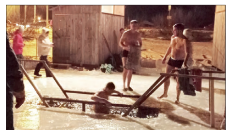
Купель на водоеме с. Кунгурка

В этом году зима не принесла нам традиционных крещенских морозов. Сравнительно теплая, до -15 градусов, температура воздуха не остановила жела-