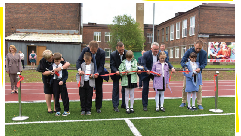
Открытие стадиона в школе №1

2022 года состоялось торжественное открытие. На площадке имеются футбольное поле с