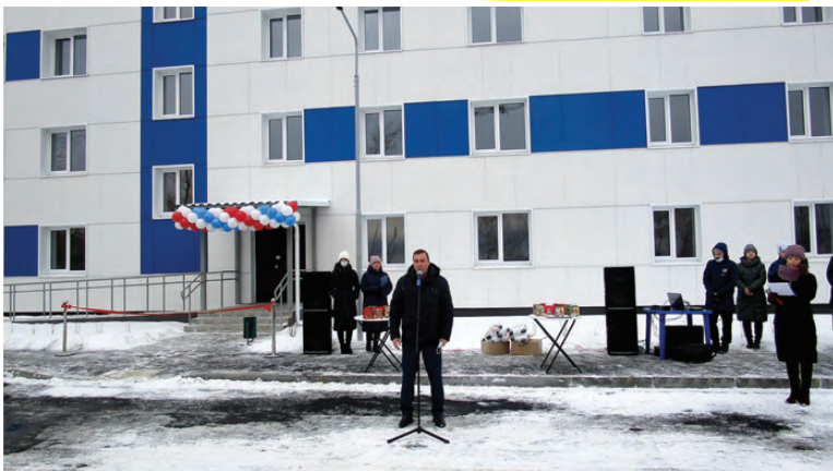
Новый дом по ул. Чехова, 15

Два главных направления нацпроекта «Жилье и городская среда» – переселение граждан из аварийных домов в новые квартиры и улучшение городских пространств.