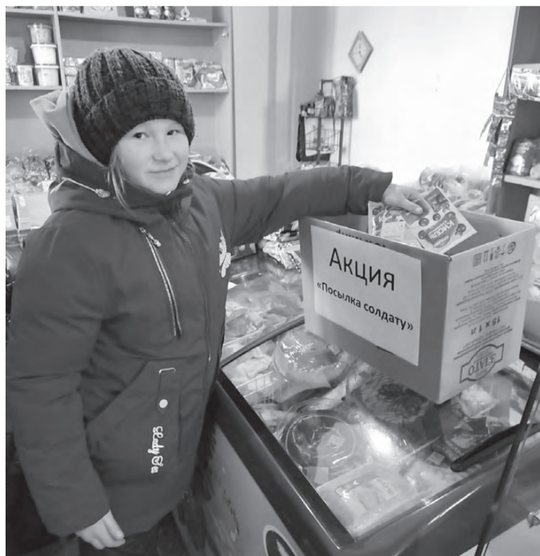
Жители Дачного собирают посылки