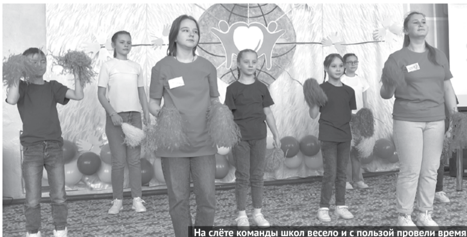
На слёте команды школ весело и с пользой провели время.

Волонтеры Богдановича участвовали в работе круглого стола, мастер-классе, тренинге, делились опытом и общались. Так в Тыгишской школе проходил VII районный слёт «Доброе сердце», собравший 12 волонтерских команд из восьми сельских и четырёх городских школ