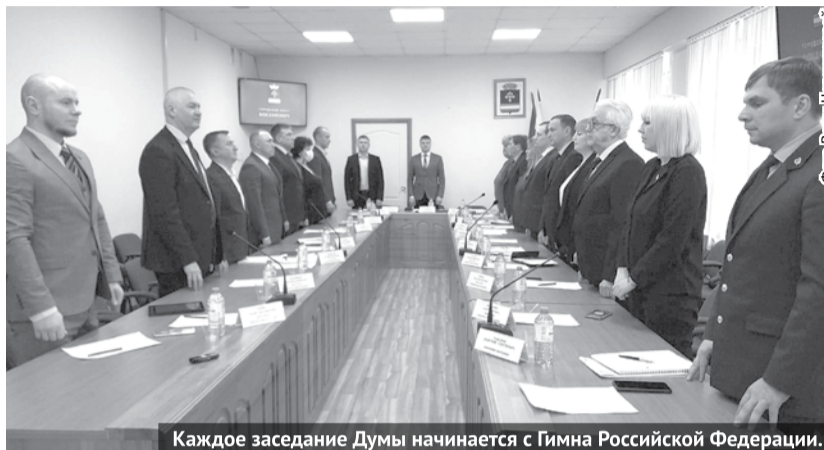
Каждое заседание Думы начинается с Гимна Российской Федерации.

На январском заседании Думы ГО Богданович присутствовало 16 депутатов. Народные избранники рассмотрели вопросы бюджета городского округа, а также утвердили изменения, внесённые в ряд документов