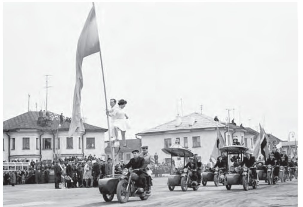
Парад на площади, середина 1960-х