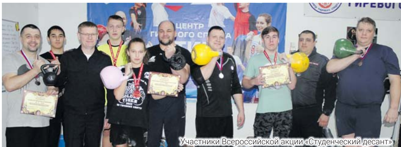
Участники Всероссийской акции «Студенческий десант»