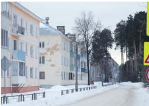
В посёлке две улицы: Центральная (с многоэтажными домами)...

– Когда президент России объявил социальную газификацию, жители стали обращаться к нам в сельскую администрацию с вопросом участия в данной программе. Мы со своей стороны узнали, что такая возможность у них есть, даже с учётом того, что газ по посёлку не идёт. И помогли желающим собрать документы, дистанционно подать заявки и получить договоры.