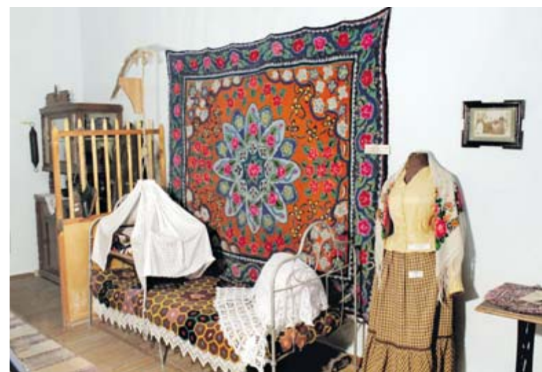
Этот зал полностью обновится

Большое внимание мы уделяем условиям для работы с посетителями с ограниченными возможностями здоровья. У нас есть отдельное помещение для санитарной комнаты для людей с инвалидностью, где будут установлены специальные поручни, унитаза, раковина и прочее. Также появятся тактильные таблички со шрифтом