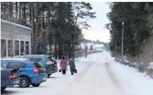
...и Курортная (с частным сектором)