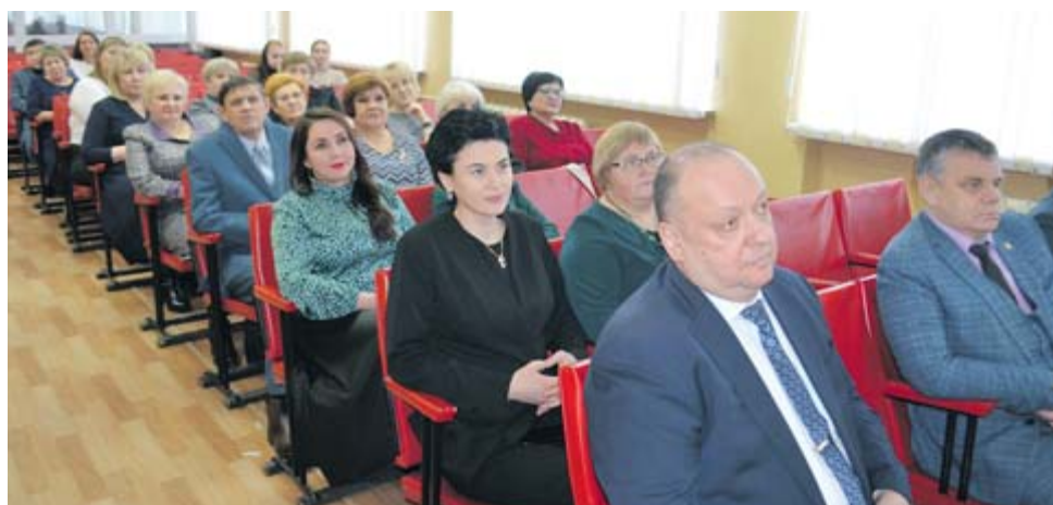
Участники и гости мероприятия