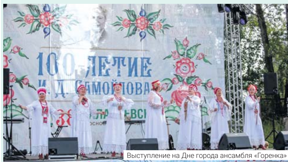
Выступление на Дне города ансамбля «Горенка»

Интересным и неожиданным стал конкурс по аквагриму, главным условием