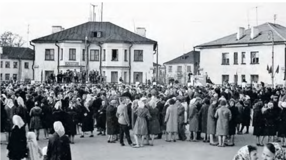
На площади проходили танцы, 1 Мая 1965 года. Оркестровую трибуну убрали в 1967 году

Л. ПРОТОПОПОВА Фото предоставлено автором