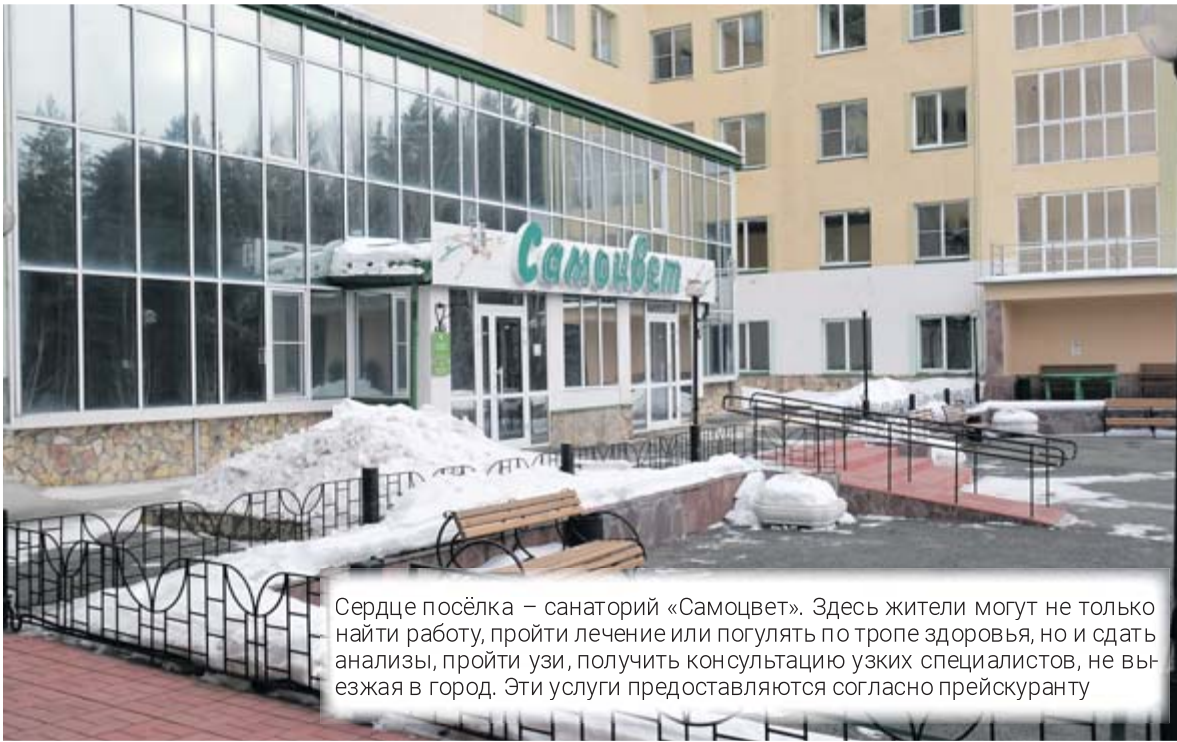
Сердце посёлка – санаторий «Самоцвет». Здесь жители могут не только найти работу, пройти лечение или погулять по тропе здоровья, но и сдать анализы, пройти УЗИ, получить консультацию узких специалистов, не выезжая в город. Эти услуги предоставляются согласно преискуранту