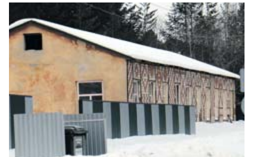
Идёт ремонт в здании бывших механических мастерских, выкупленных из муниципальной собственности в частные руки. Что будет там после ремонта – новый собственник пока не сообщает. Возможно, откроется какое-то новое производство, так как помещение нежилое.

– В нашем посёлке все дома благоустроенные, ведь он изначально строился как самодостаточный населённый пункт. Даже во всех частных домах центральные водопровод, канализация и отопление. Ну разве что в последние годы кое-кто перешёл на электротокотлы. А так – нет даже общественных колодезь. И лишь недавно я увидела у одного нового дома скважину, – поясняет Марина Шаньгина. – Кроме того,