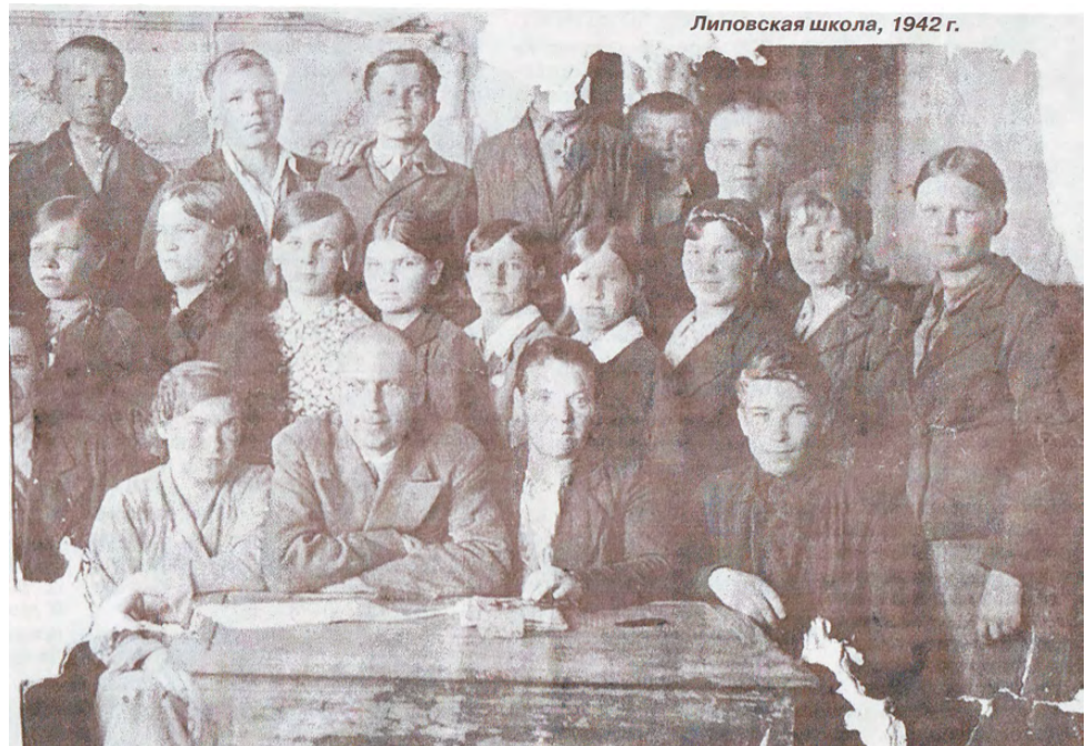
Липовская школа, 1942 г.