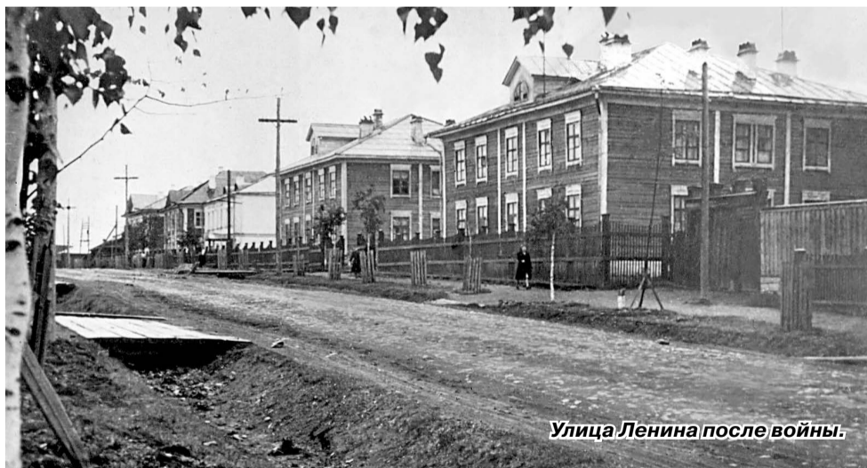
Улица Ленина после войны.