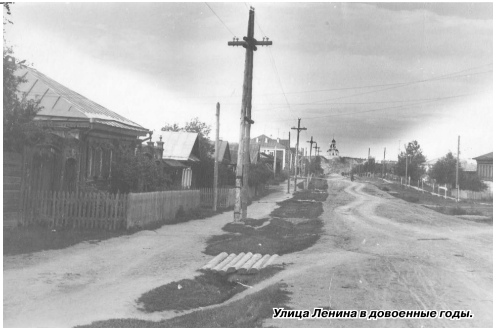
Улица Ленина в довоенные годы.