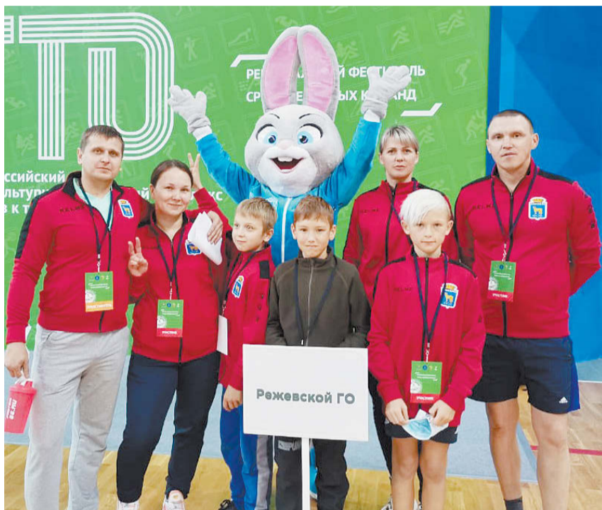
Режевские команды-участницы регионального фестиваля Всероссийского физкультурно-спортивного комплекса ГТО.

Среди задач фестиваля – не только популяризация комплекса ГТО в системе семейного физического