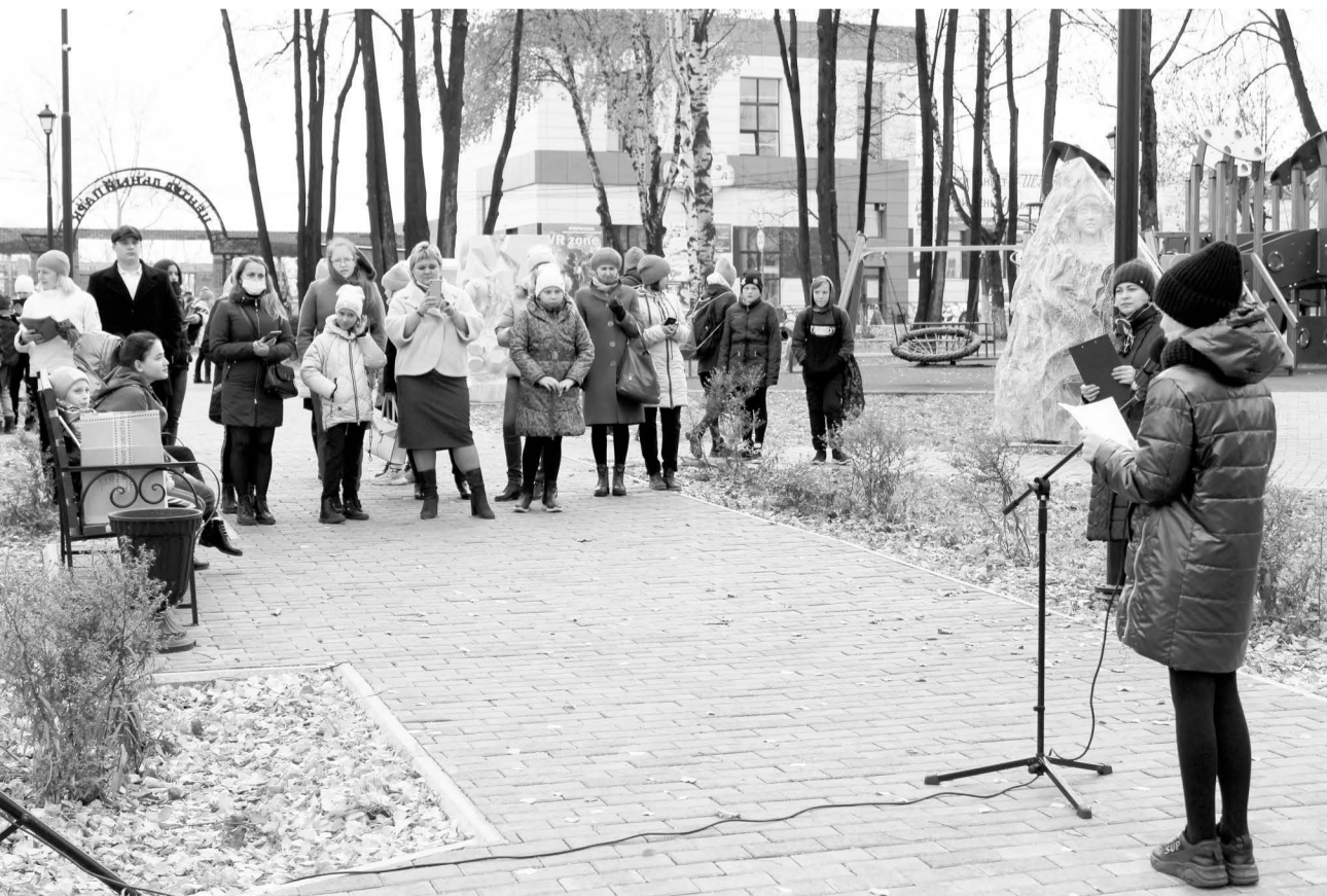
Акция «День чтения» прошла в парке «Центральный».