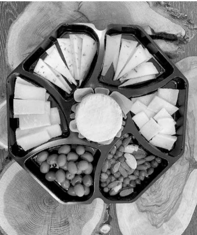
Режевляне с удовольствием покупают сыр местного производства.

По данным экспертов, пищевая промышленность Свердловской области показывает стабильный рост. По данным, которые опубликовала Федеральная служба государственной статистики, за прошлый год инвестиции в основной капитал в производстве пищевых продуктов на Урале составили 1,12 млрд руб. Первое место по инвестиционному интересу на Среднем Урале закрепилось за молоком и кисломолочными продуктами.