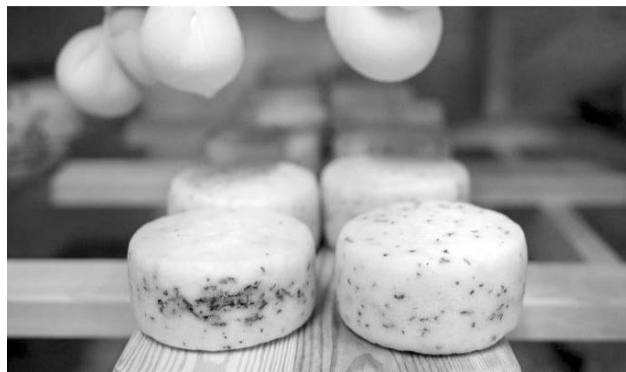
Гости города могут прийти в сыроварню на экскурсию: там им всегда рады.

18 октября свой профессиональный праздник отмечают работники пищевой промышленности. В преддверии этого праздника мы хотим рассказать вам о довольно необычном для нашего округа бизнесе - изготовлении