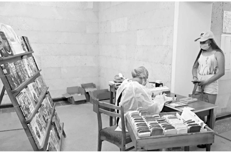
В библиотеке «Гавань» идёт выдача книг.