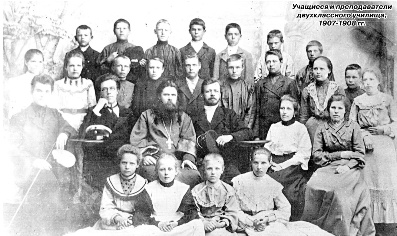
Учащиеся и преподаватели двухклассного училища, 1907-1908 гг.