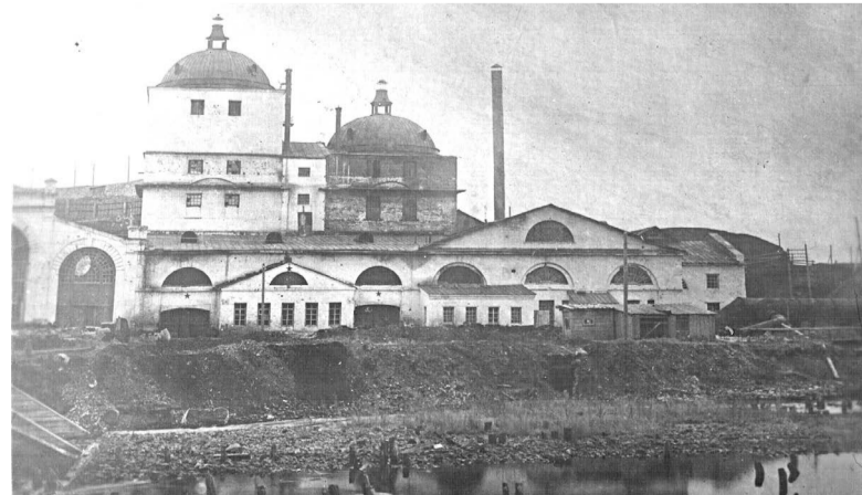
Цеха Режского никелевого завода.