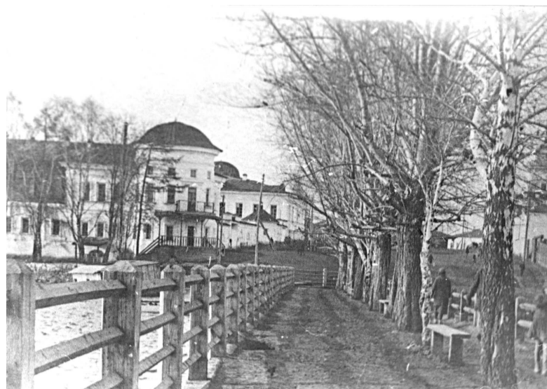
Вид со старой плотины.

генды связаны с таинственными подземными переходами, связывавшими дом заводоуправителя со многими зданиями старого города. По рассказам, в XIX веке в Реже была создана целая система подземных переходов, соединявшая наиболее важные здания посёлка. Протянувшись на сотни метров, эта система представляла собой сложное инженерное сооружение, переходы точно соединяли несколько зданий, защищались крепежами, имели тупиковые коридоры и комнаты, а также множество дверей.