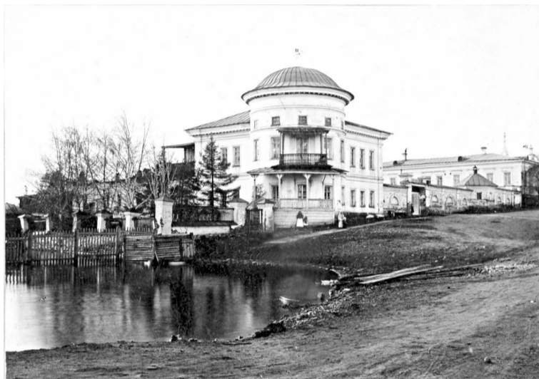
Господский дом (усадьба заводовладельца).

вания заводского начальства. Самой заметной фигурой из