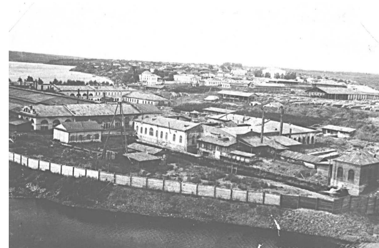
Общий вид завода, 1911 г.

В связи с полной отработкой Липовского месторождения, начиная с 1990 года завод перешёл на переработку привозных руд Серовского месторождения. В 1996 году предприятие было преобразовано в ОАО «Режский никелевый завод», а в 2000 году в ЗАО «Производственное объединение «Режникель». В 2017 году, на 81 году производственной деятельности, завод прекра-