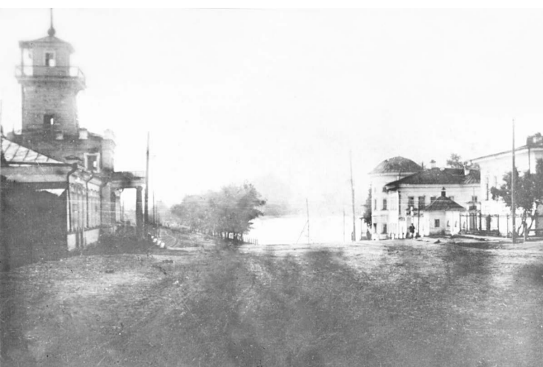
Вид на Господский дом, 1910 год.

Вот уже почти два века левый берег Режевского пруда украшает интересный по архитектуре Господский дом. Назывался он так, потому что предназначался для проживания приказчиков, управляющих и иного заводского начальства. Дом заводоуправителя в Реже был построен в первой половине XIX века при Алексее Яковлеве, внуке Саввы Яковлева. Архитектором этого здания был Степан Багряцев.