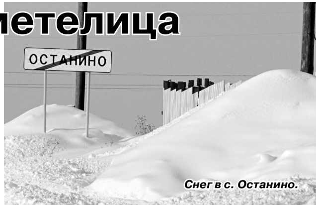
Снег в с. Останино.

Чем ближе к зиме, тем больше и больше наваливает снега. Он уже не лежит тоненьким слоем, а закрывает сады и огороды теплой толстой шубой. Это хорошо для наших растений, которые хоть и привыкли к нашему неустойчивому климату, но без снега зимовать не могут. Много работы сельским жителям, которым каждое утро приходится разгрести подъезды к домам. Дорожные службы тоже не сидят без дела: грейдеры снуют туда-сюда. Это взрослым работа, а у детворы начинаются снежные забавы.