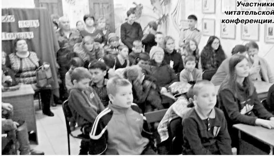
Участники читательской конференции.

Ты сильный город, Ленинград, Ты выжил в дни блокады, Ты выдержал весь этот ад. Как этому мы рады!