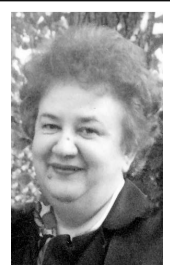
Семья, внучка, муж.