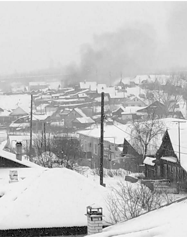
Пожар на улице Щербакова.

Первого февраля в 13.33 в пожарную часть № 223 поступил вызов: на улице Щербакова загорелся дом. 16 пожарных на четырех машинах выехали на тушение. Итог пожара: частично повреждена кровля, чердачное покрытие, стены и домаш-