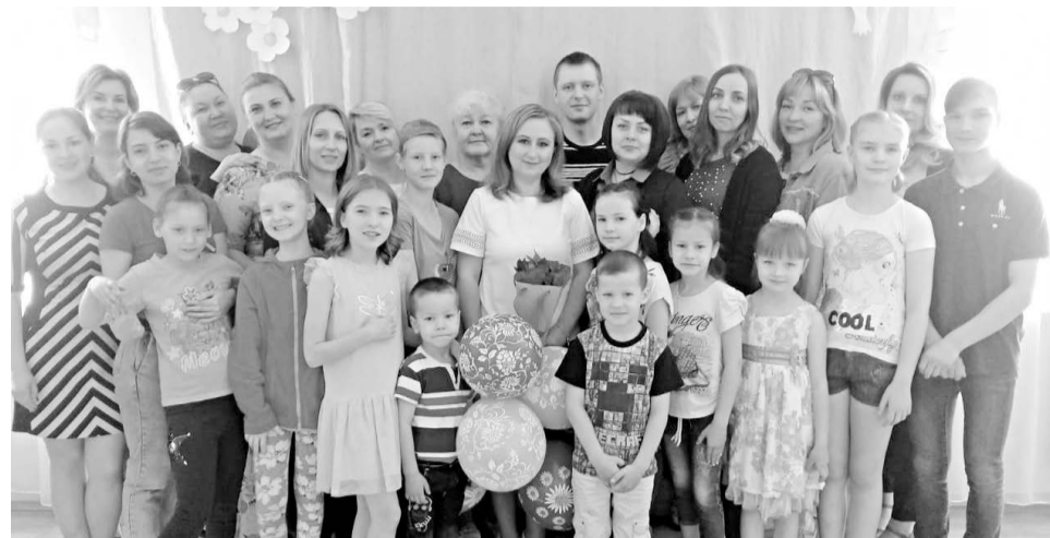
Коллектив и воспитанники социально-реабилитационного центра, 2019 год.

Конечно, я как руководитель учреждения, понимаю, что мы работаем с очень сложными детьми, и очень хорошо, когда ребёнок среди всего коллектива сотрудников находит для себя такого человека, с которым он может поделиться своей болью, тогда специалисты смогут корректно помочь ребёнку, убрать озлобленность и негатив. Данная работа ведётся всеми специалистами центра и каждым в отдельности. В работе присутствует ярко выраженный индивидуальный подход по всем направлениям деятельности специалистов, как в стационарном отделении и отделении профилактики, так и в отделе-