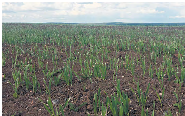
Свежие всходы на полях СПК «Глинский».

В Режевском районе, по данным управления АПК и продовольствия, на 21 мая план посевных работ по посеву яровых выполнен на 83 процента, а зерновых на 89 процентов. В целом, по управлению (Режевской и Артёмовский районы) процент выполнения плана посевов составил 91 процент, что выше среднеобластного показателя. Отметим, что в 2019 году на эту дату аграрии посеяли 39,8 процентов яровых и 33,3 процента зерновых культур.