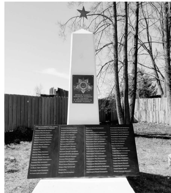
Обелиск в селе Каменка.

На сегодняшний день на нашей территории проживают 11 тружеников тыла, 2 вдовы и 12 детей войны. Труженикам тыла и вдовам вручены памятные