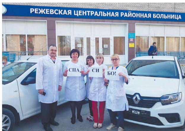
Спасибо за помощь!

Новые машины отданы в распоряжение амбулаторно-поликлинической службы, их основным предназначением будет доставка участковых терапевтов по вызовам. На