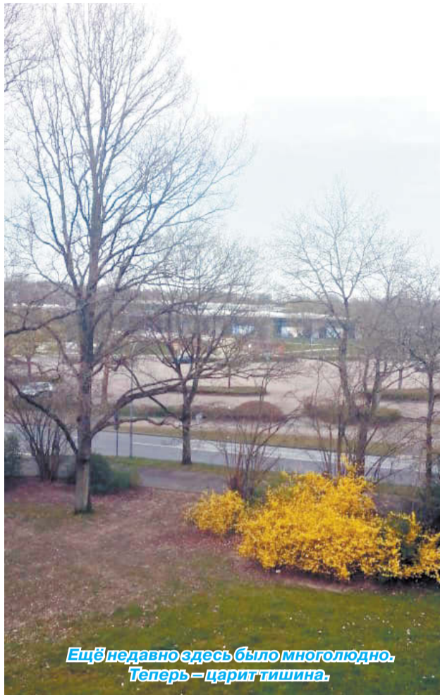
Ещё недавно здесь было многолюдно. Теперь – царит тишина.

Новость о заболевшем в соседнем городе обрушилась на жителей как гром среди ясного неба. «Я пришла на работу, мы включили радио, собрались вокруг него, чтобы послушать новости, - вспоминает она. - На тот момент был выявлен зараженный в Баварии, но мы были уверены, что до нас вирус не дойдет. Поэтому новость о заболевшем в соседнем городе всех повергла в шок». Первым зараженным был пожилой мужчина. «Ежегодно в Германии проводят карнавалы в городах. В этот раз он был во второй половине февраля. И этот мужчина также посетил праздник. Когда узнали, что он болен, постарались найти людей, с кем был контакт. И отправили их на каран-