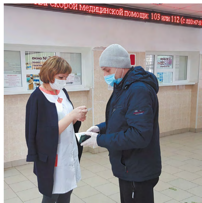
При входе в больницу посетителей встречают сотрудники колл-центра.

Возможно, кому-то новые порядки в работе больницы покажутся обременительными. Но растущее число зара-