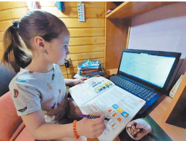
Самоконтроль – наиболее сложное в домашнем обучении!

«Когда уже в школу?» – это был самый задаваемый вопрос детьми, учителями и родителями на третий день дистанционного обучения.