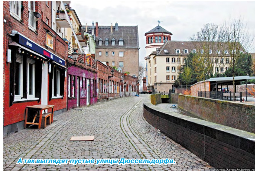
А так выглядят пустые улицы Дюссельдорфа.