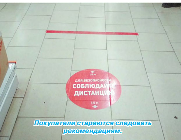
Покупатели стараются следовать рекомендациям.

Подготовила Дарья ОБЛАСОВА.