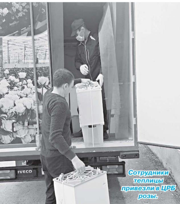
Сотрудники теплицы привезли в ЦРБ розы.

Подготовила Е. ГОРОХОВА.