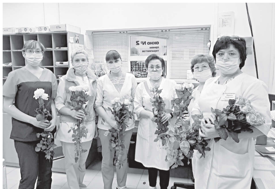
Рабочий день врачей в это непростое время начался с приятных минут.

Школы округа с 6 апреля начали вести обучение в дистанционном режиме. Для того чтобы каждый мог учиться в новых реалиях, компания «Мотив» предоставила образовательным учреждениям 109 сим-карт с доступом в