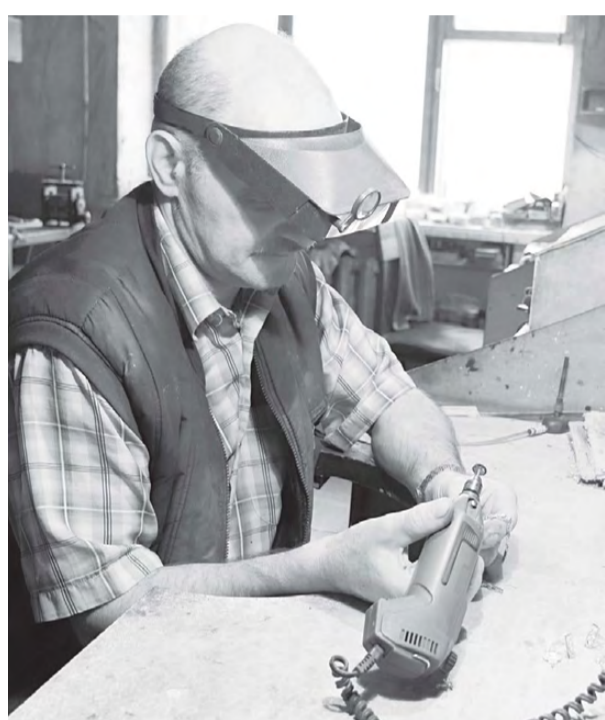
Таинство работы мастера.

Эта постоянная рубрика будет посвящена национальному проекту «Малое и среднее предпринимательство» и призвана знакомить читателей с представителями малого и среднего бизнеса Режа. Большинство предпринимателей даже в сложных экономических условиях не только сохраняют производство, но и успешно развивают его, создавая новые рабочие места. Об этом и пойдёт речь.