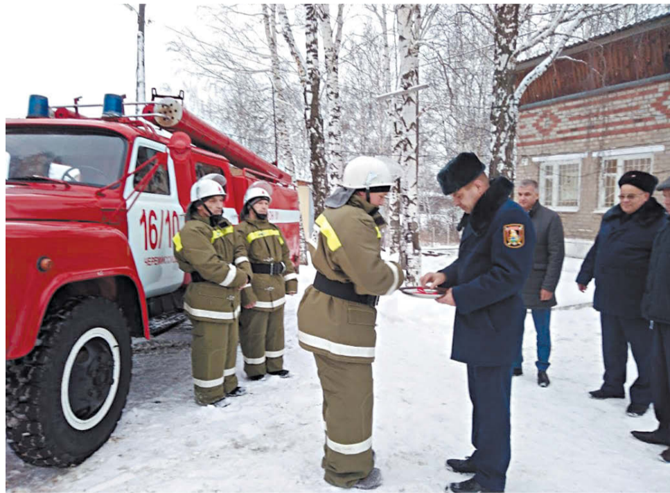
Вручение ключей от автомобиля добровольцам.

Подготовила Дарья ОБЛАСОВА по данным инспектора по основной деятельности ПЧ №16/10 С. АМОСОВОЙ.