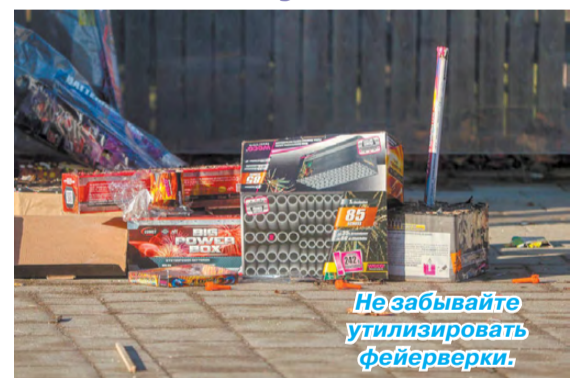
Не забывайте утилизировать фейерверки.

В нашем городе есть множество магазинов, отделов и палаток, где продают пиротехнику. Перед праздниками мы, не задумываясь, приобретаем салюты и фейерверки. Правильно ли хранился товар? Есть ли у него сертификат? Простым покупателям эту информацию порой некогда уточнять. Зато сотрудники территориального отдела надзорной деятельности и профилактической работы совместно с сотрудниками полиции нашли время на проведение в РГО профилактических рейдов в местах реализации пиротехнической продукции. Большое внимание обращали на соблюдение требований пожарной безопасности. Проверяли