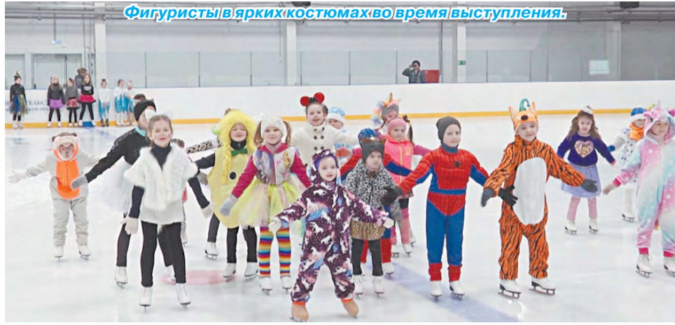
Фигуристы в ярких костюмах во время выступления.