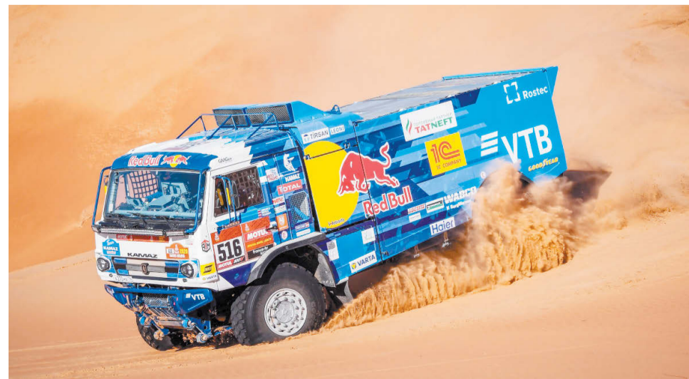
«КамАЗу» покоряется пустыня!