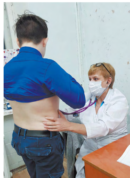
На приеме в детской поликлинике.