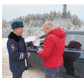
Идет беседа с водителями.

На региональной автодороге инспекторы отделения ГИБДД ОМВД России по Режевскому району провели акцию «Дорога - не место для преувеличений». Акция проводилась с целью профилактики дорожно-транспортных происшествий с участием водителей, выезжающих на встречную полосу. Инспекторы напомнили автолюбителям, чем опасны такие маневры, как обгон и выезд на встречную полосу. За январь 2020 года произошло 4 дорожно-транспортных происшествия из-за выезда на встречную полосу движения, в одном из которых 1 несовершеннолетний пассажир пострадал.