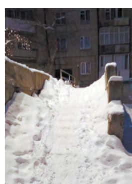
Несите ледянки, будем кататься!