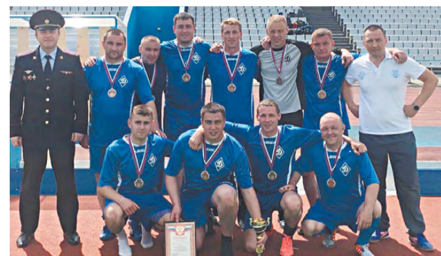
Команда полицейских из Режа.