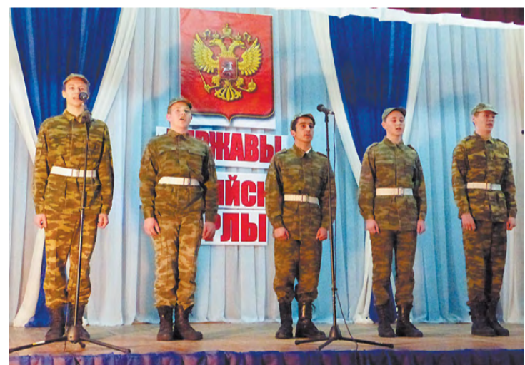
На сцене команда с. Останино.