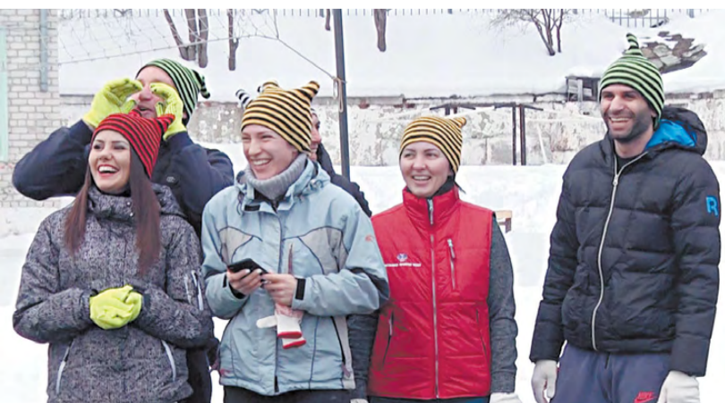
Команда «Полосатый рейс».