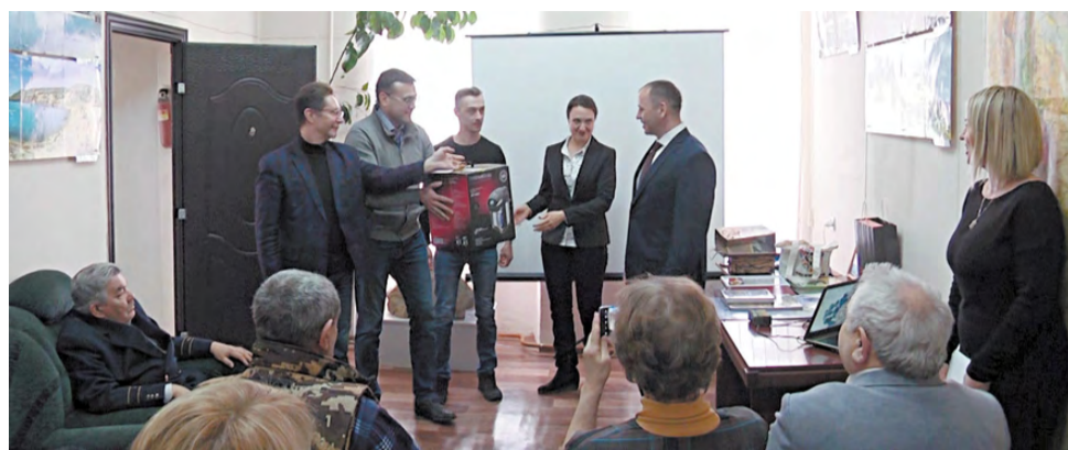
Поздравление коллег - руководителей особо охраняемых природных территорий.

сотрудников, кто в настоящее время осуществляет деятельность как на территории заказника, так и в помещениях его музея.