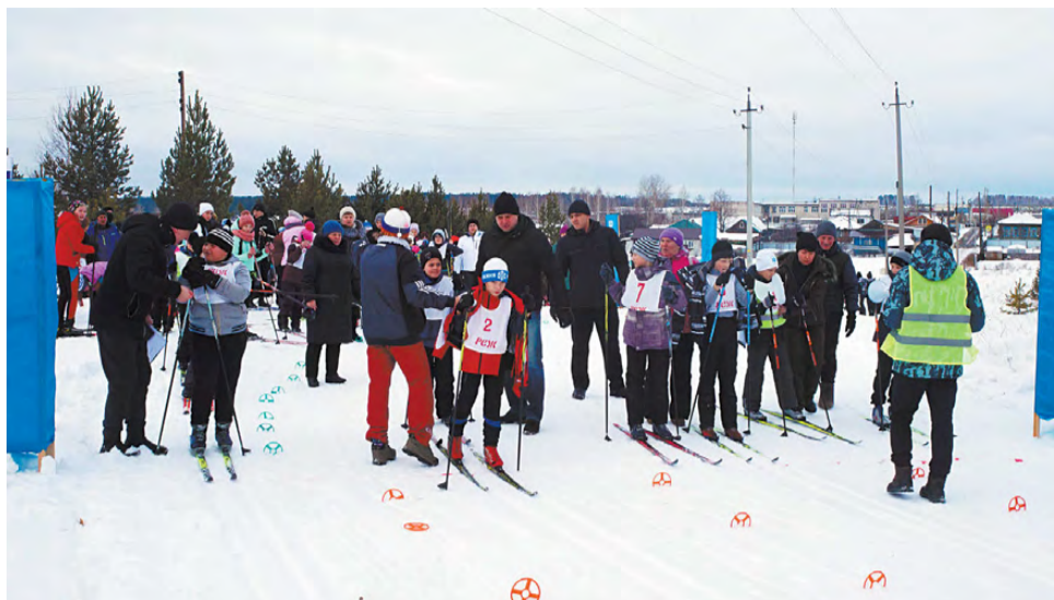
Один из стартов эстафеты.

спортивном зале школы. На построении организаторы мероприятия и учащиеся поприветствовали любителей лыжи. После чего все команды и представители массстарта прошли к месту соревнований.