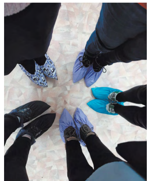
Так выглядят бахилы многоцветного использования.

Знаете ли вы, что с той поры, как был придуман пластик, еще ни один пакет не успел разложиться. А ведь только за одну минуту мы используем 200 000 пластико-