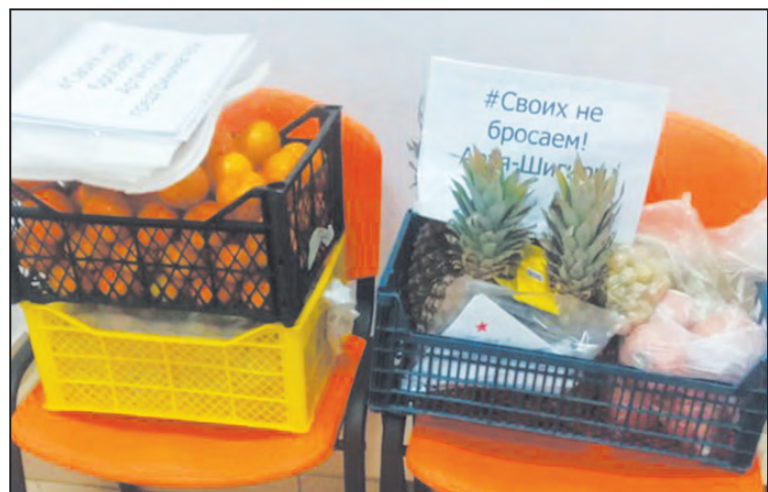
Своих угощаем! Подарки из Артя-Шигирей