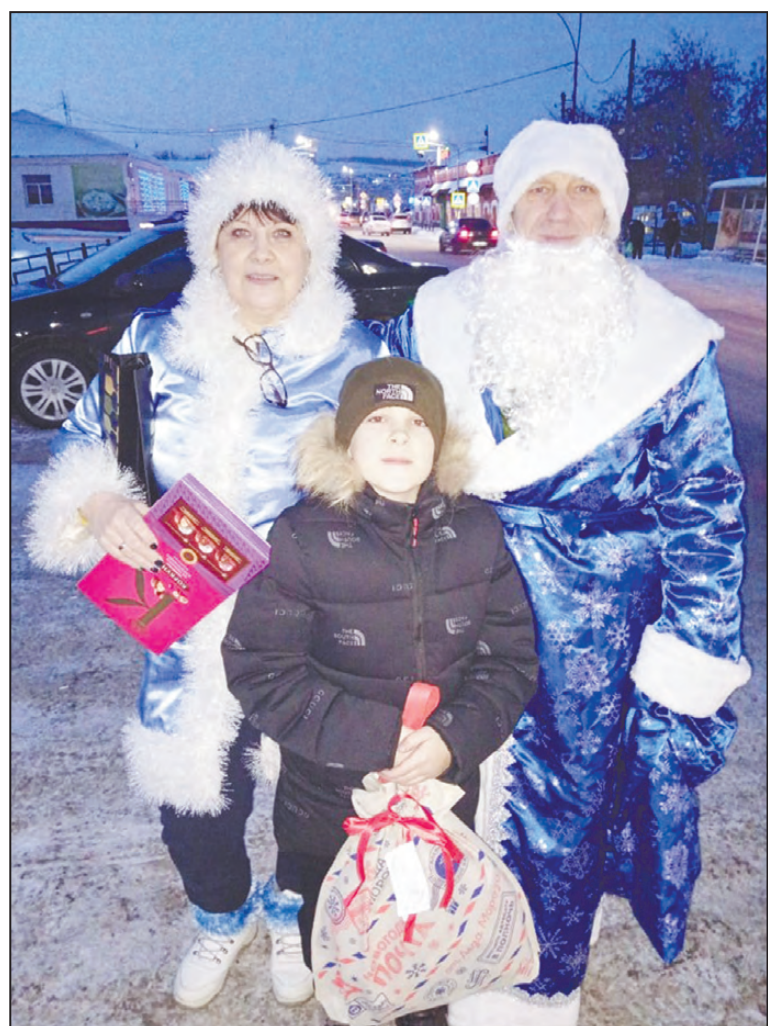
Папа мобилизован? Получи подарок!