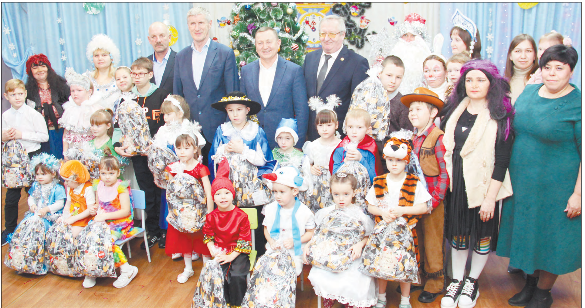
Фото с гостями на память в социально-реабилитационном центре. Пусть каждая елка будет елкой исполнения желаний!