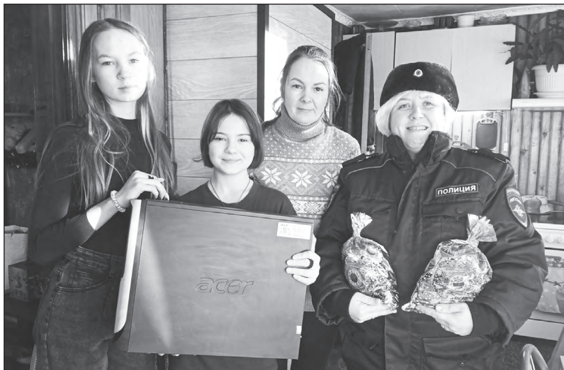
Семья Саши и Снегурочка в должности майора полиции

ОМВД России по Артинскому району Фото из архива отдела