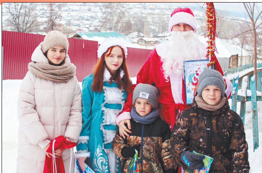
Добро делает мир лучше