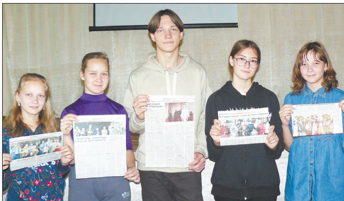
Газета пишет и о нашей студии. И так уже 30 лет!

- О нашей дружной, многодетной, творческой семье также был очерк в «Артинских вестях». И это очень здорово! Читаешь и наполняешься еще большей любовью к родным людям и хочется, чтобы в каждой семье укреплялись традиции и все были счастливы. Наша семья также является участником волонтерского движения «Манчажцы - родному селу» - родители помогают в проведении благотворительных акций. Мама часто была Снегурочкой, папа - Дедом Морозом и другими новогодними персонажами. Вместе с учащимися студии они поздравляли пожилых людей. А еще мы всей семьей высаживали бархатцы вдоль пешеходной дорожки по ул. Советской. Театральная студия «Радость» входит в это движение и активно себя про-