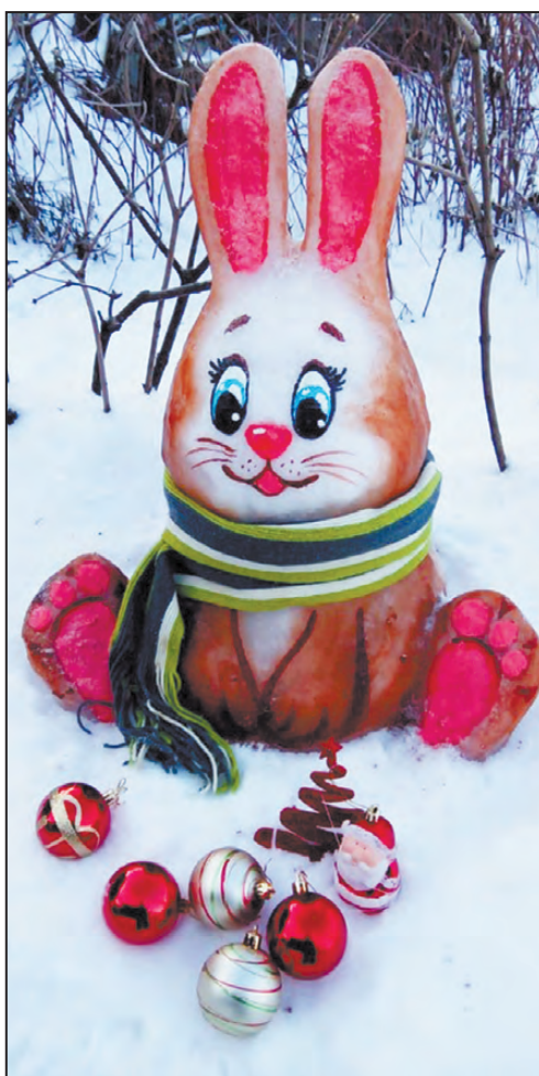
Ну, заяц, погоди!