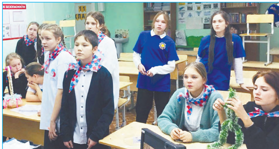
На Зимнем фестивале было тепло

Зимфест, нетворкинг, квест – на бойтесь этих слов!