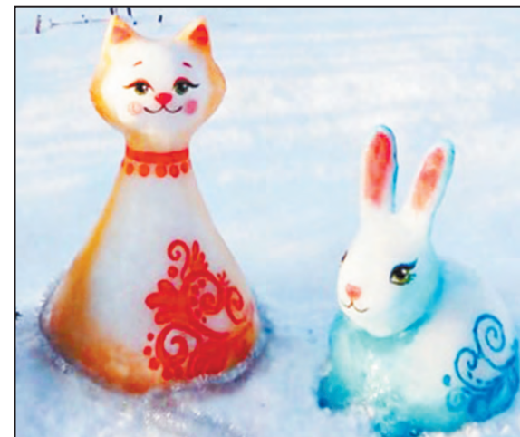
Рядом с лисичкой-сестричкой