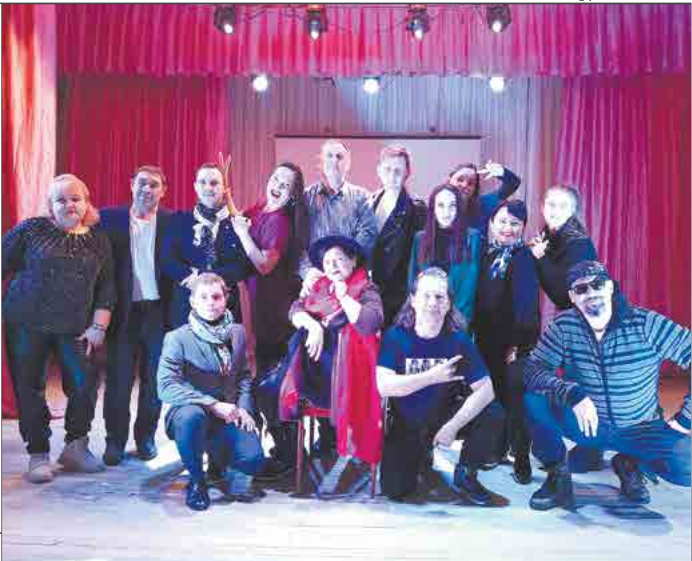
Все артисты спектакля «Кинозолушка» — это, возможно, рождение нового творческого коллектива в Ревде. Он называется в честь гормона счастья — «Дофамин».