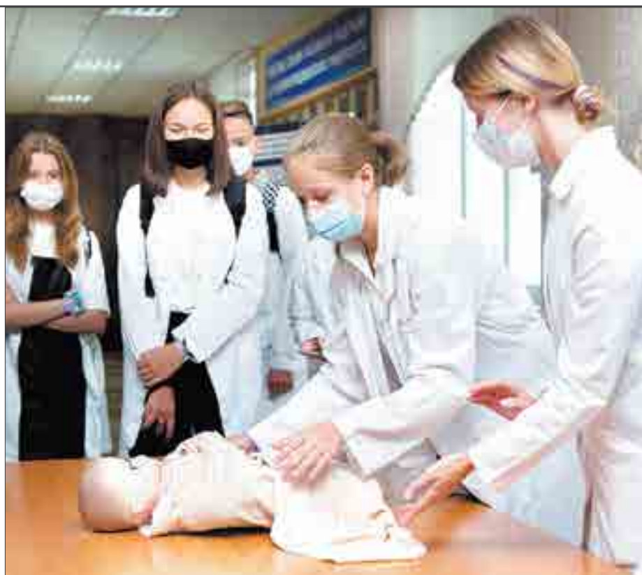
Слушателей медкласса ждет полное погружение в профессию.

28 ноября в 18:00 ждем всех желающих на организационное собрание в школе №28.