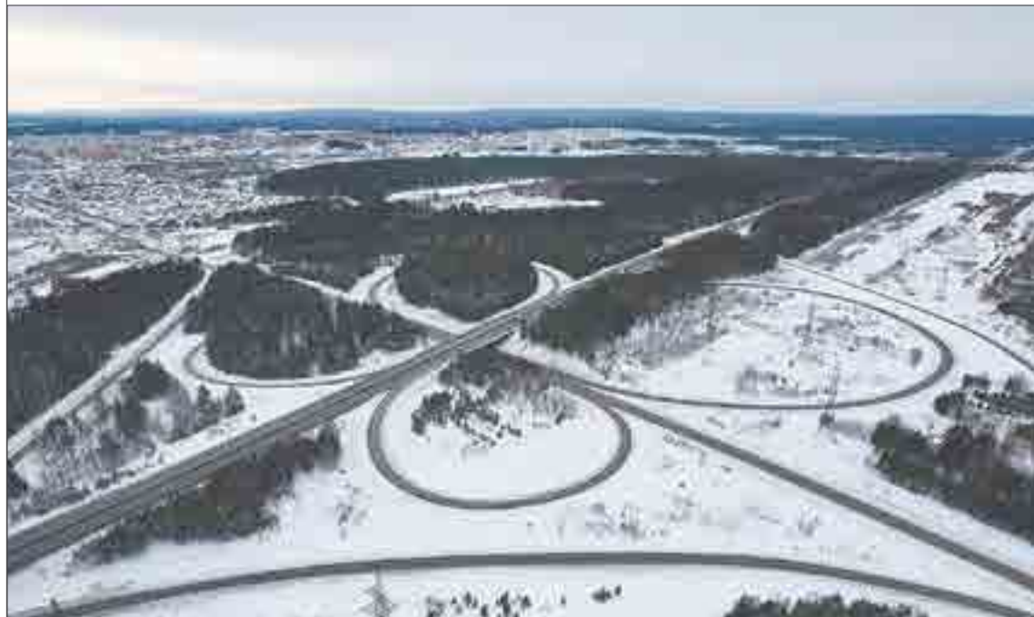
Ревдинская развязка. Все съезды отремонтируют. А вот путепровод до четырех полос расширять не будут.

Сейчас идет поиск подрядчика. Конкурсный отбор закончится 2 декабря. Согласно проекту, полностью капитальный ремонт должен завершиться 1 сентября 2024 года.