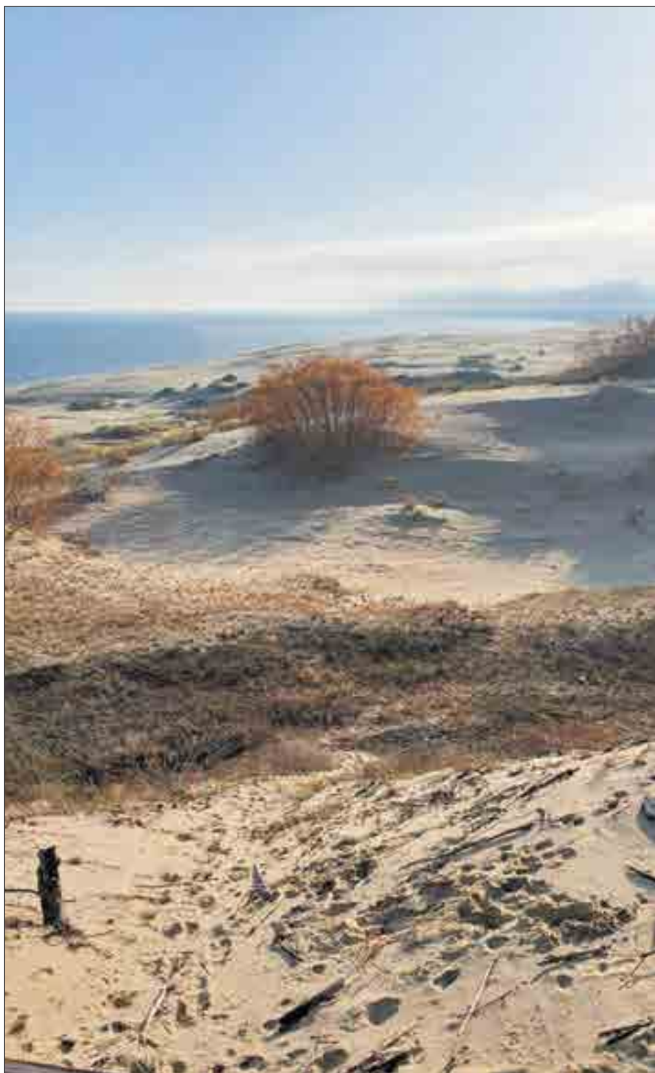
Куршская коса. Высота Эфа.