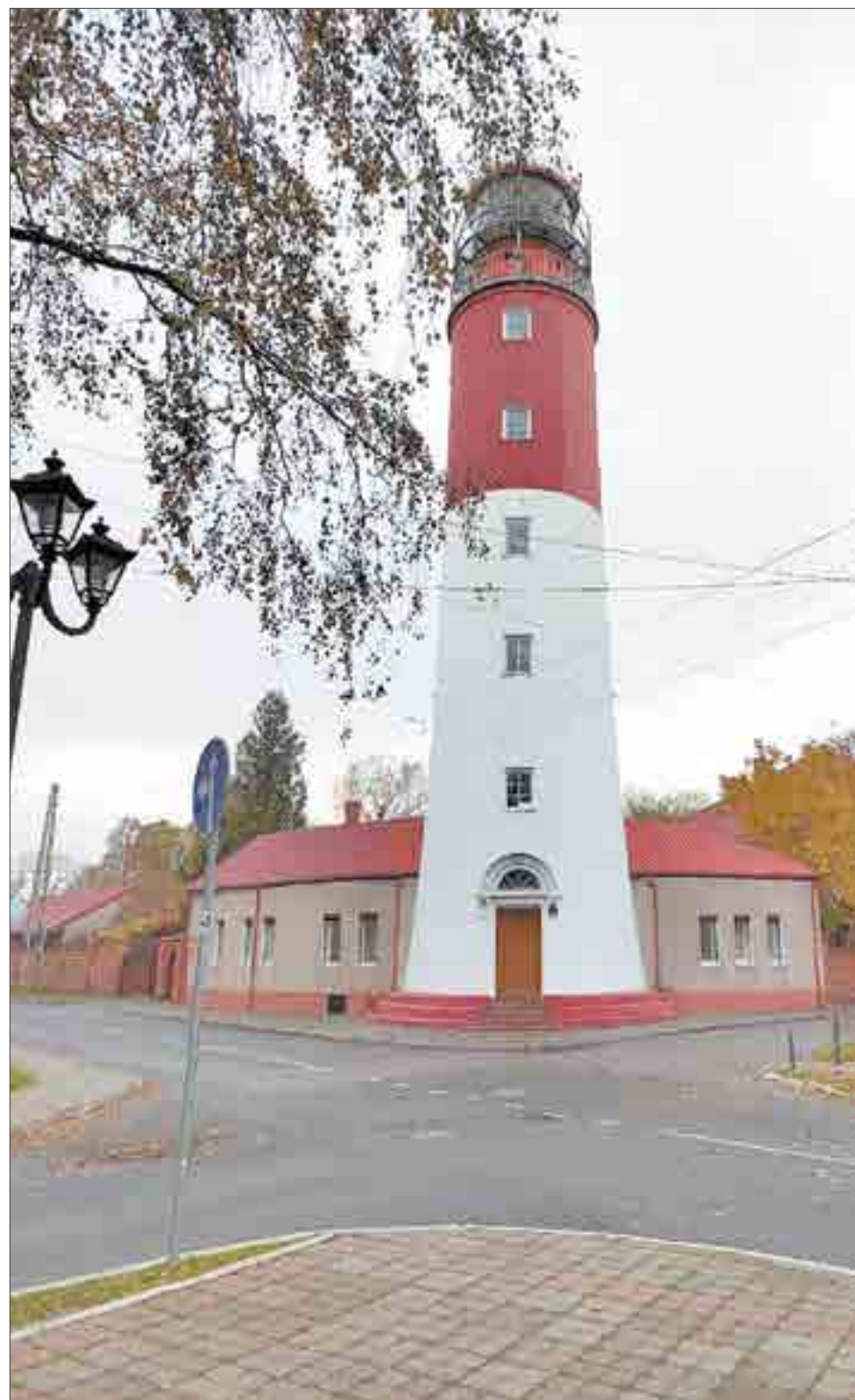
«Балтийский» маяк.