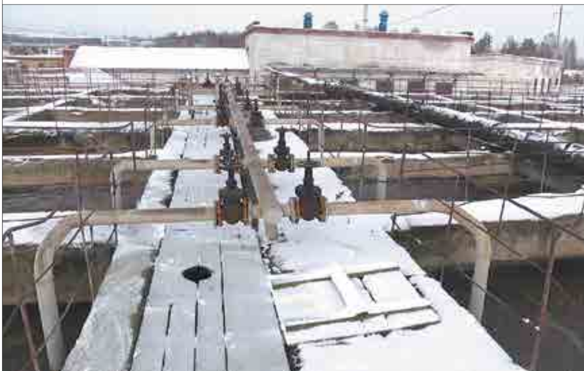
В ходе реконструкции на ХБК должны быть построены несколько сооружений и внедрена новая технология, которые позволят снизить нагрузку на экологию и сэкономить средства на закупку энергоресурсов.

И я очень рад, что большинство депутатов понимают, насколько будущий объект важен и для городской инфраструктуры, и для экологии Ревды. Поэтому решение было принято 14 голосами «за», только двое участников заседания оказались против, и один воздержался.