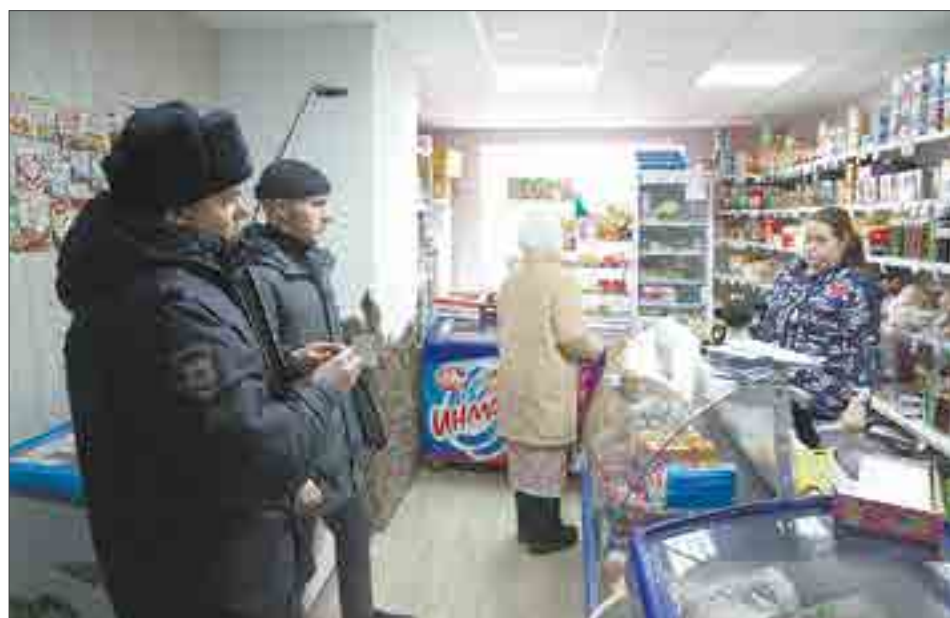
В магазине на Ледянке. По словам участкового, здесь собирается вся информация с поселка.