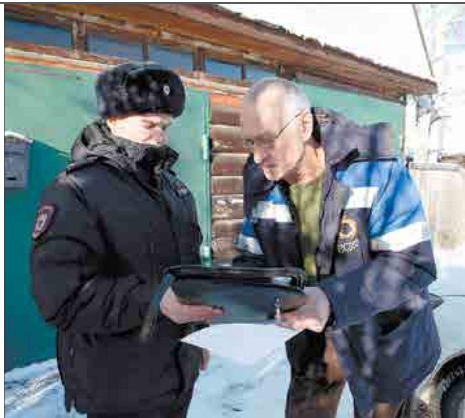
Участковому нужно много общаться с людьми. Например, чтобы собрать показания свидетелей.

В опорном пункте прохладно. Ночь была холодная, отопления тут нет, обогреватель спасает не сразу. Небольшая комната, стол, компьютер, пара стульев. Здесь участковый проводит приемы граждан во вторник, четверг и субботу с 17 часов. Правда, из-за ковида люди отвыкли от приемов. В пандемию они ведь были заперены. Все привыкли по телефону звонить.