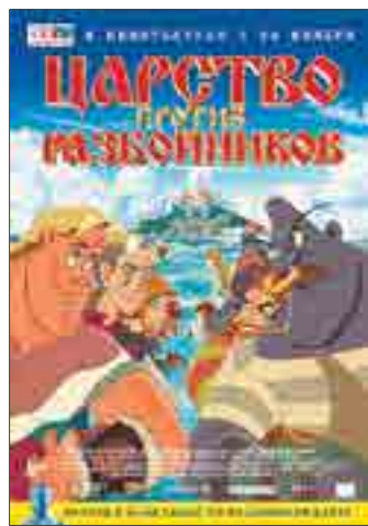
ЦАРСТВО ПРОТИВ РАЗБОЙНИКОВ

ПЕТР I. ПОСЛЕДНИЙ ЦАРЬ И ПЕРВЫЙ ИМПЕРАТОР 12+ 11:40