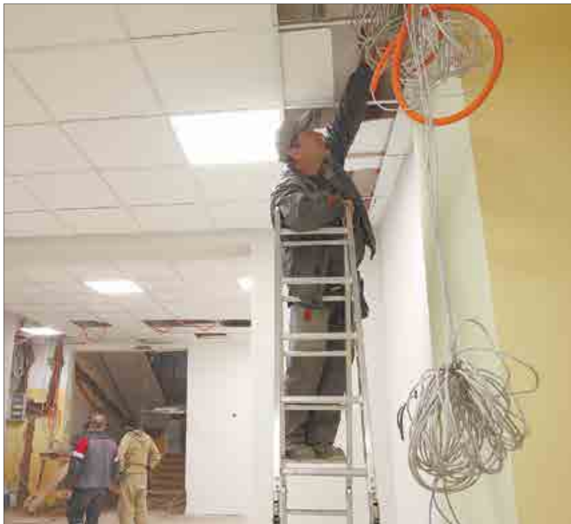
Первое, что уже бросается в глаза — в школе №29 стало невероятно светло. Смонтирована новая система освещения, а коридоры и классы раскрашены в светлые и яркие тона.

— В старой части, где учебные классы, почти все готово, — ведет нас по школе Анато-