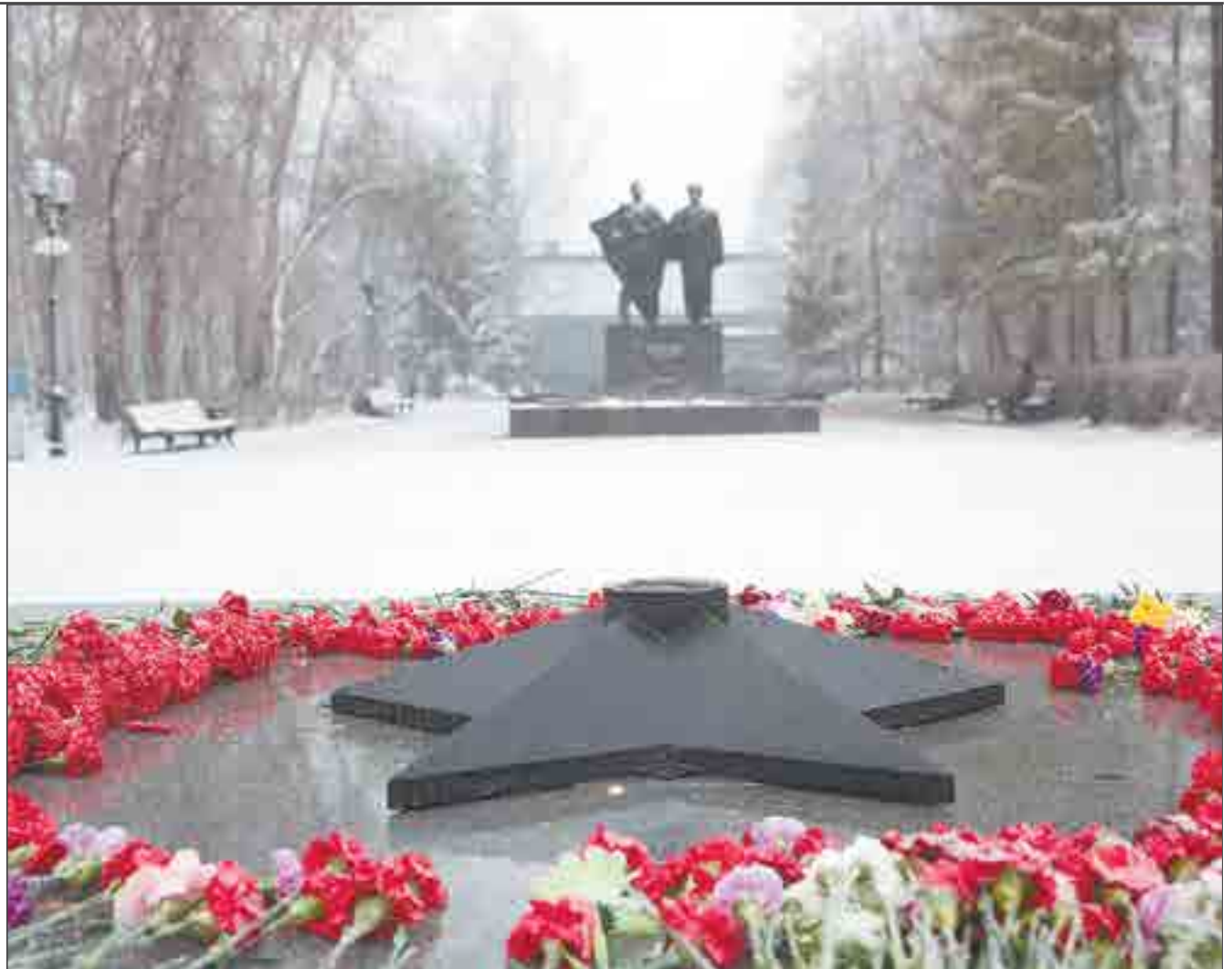
Надеемся, что таким потухшим Вечный огонь ревдинцы больше не увидят.

Розыгрыш пройдет 2 декабря. Вы сможете увидеть его в новостях телекомпании «Единство» в 19:20 на канале «360».