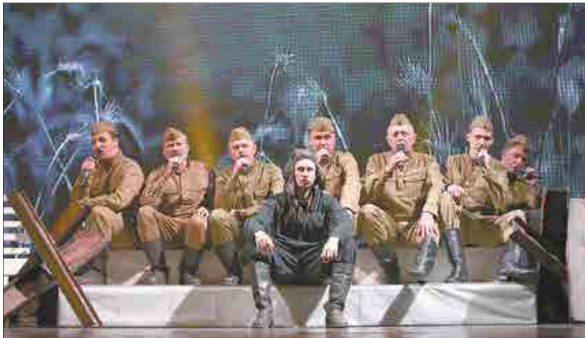
«Судьбы победителей» — это коллаж из воспоминаний о войне от самых разных людей — от солдат, от медсестёр и сыновей полков.

— Оно очень нетривиальное, — рассказывает ре-