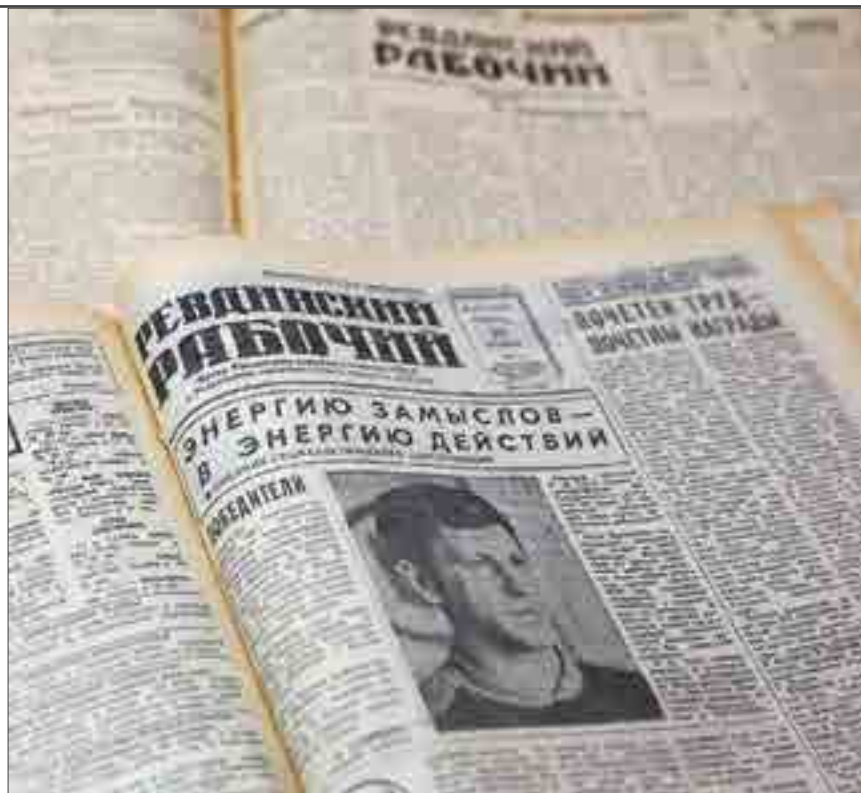
Первая страница газеты «Ревдинский рабочий», выпущенная 14 ноября 1987 года.

Р. Моросеева, член общественной приемной редакции