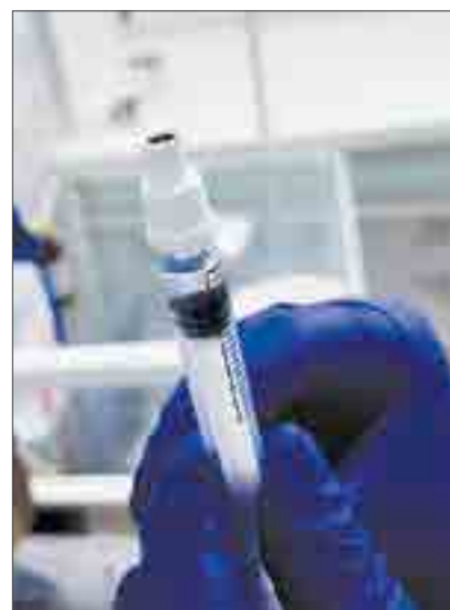
Вот так выглядит вакцина в шприце с интраназальной насадкой.

Перед введением препарата рекомендуется высморкаться, проверить проходимость носовых ходов, поочередно закрывая их и делая несколько вдохов. Специалист набирает в шприц необходимое количество вакцины, снимает иглу, надевает вместо нее дозирующее устройство и резким нажатием на поршень вводит на вдохе препарат паци-