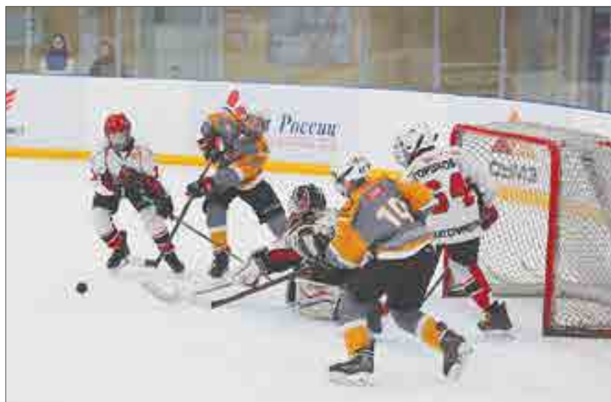
В матче с «Автомобилистом» ревдинский «Буран» сыграл с разгромным счетом 7:0.

Второму составу повезло меньше. Он записал на свой счет лишь победу над ДЮСШ-19 — 4:2. Еще бы чуть-чуть и могли одолеть «СКА-Юность», но уступили по буллитам — 4:5. Крупные поражения потерпели от «Авто-Спартак-2015» (1:10) и «СКА-Юность-2015» (1:7). «Буран-2» занял пятую строчку в таблице.