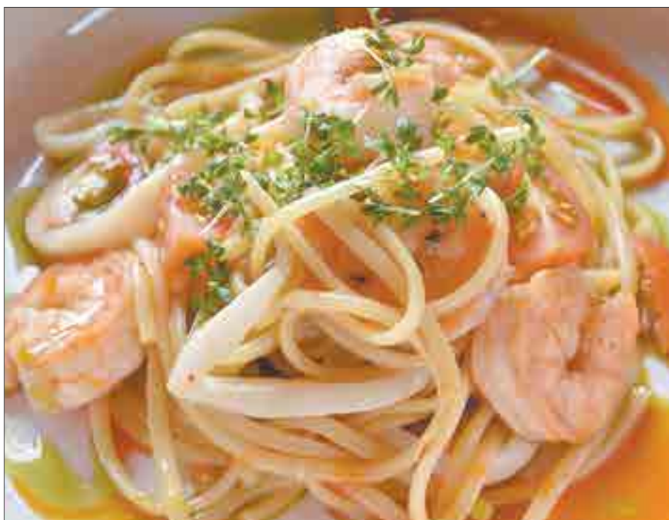
Одно из блюд, которое мы попробовали — паста с морскими гадами.