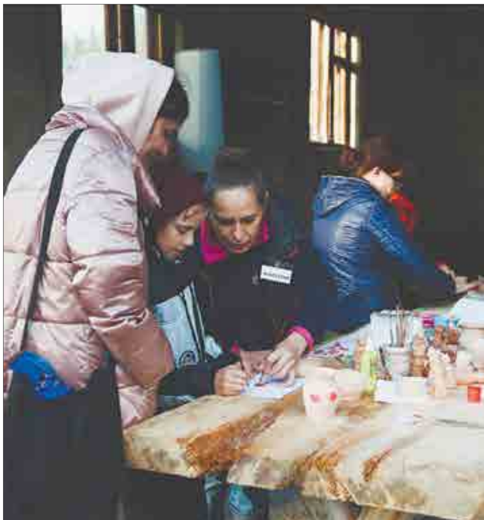
На гончарном мастер-классе все желающие могли научиться основам ремесла, а также расписать глиняную посуду.