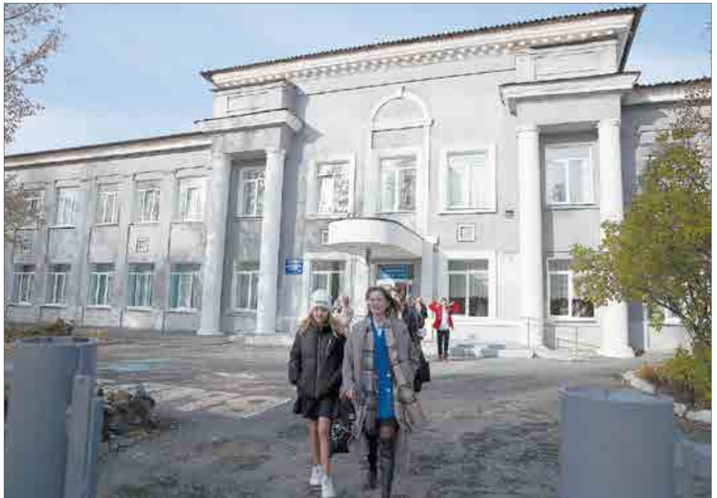
Здание педколледжа — одно из самых атмосферных в Ревде благодаря архитектуре.

Нас встречает охранник, «вертушка» и рамка металлоискателя — таковы меры безопасности. Сразу напротив входа — стена из зеркал. Ее в колледже называют «Зазеркалье». Раньше на нее вешали разные плакаты, объявления, украшали под стать какому-нибудь празднику или мероприятию. Сейчас этого не делают — стеклышки уже старенькие, надо беречь. Такой