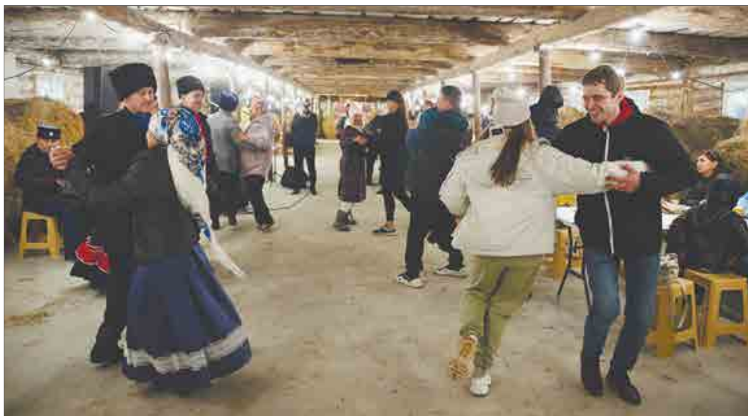
Гости уральского варианта Октоберфеста разучили кадрили, в которой целых шесть колен!

— У меня давно была мечта слепить огненную скульп-