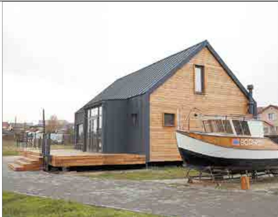
У кафе есть просторная терраса. Летом тут тоже поставят столики.

Принесли свиные колбаски с овощами гриль. Среди них — кабачок, томаты, болгарский перец. Чувствуется, что все свежеприготовленное. Но гастрономически добил горчичный гель. Чтоб вы понимали, я не люблю горчицу. Ни в каком виде. Но тут это было настолько уместно, что без раз-