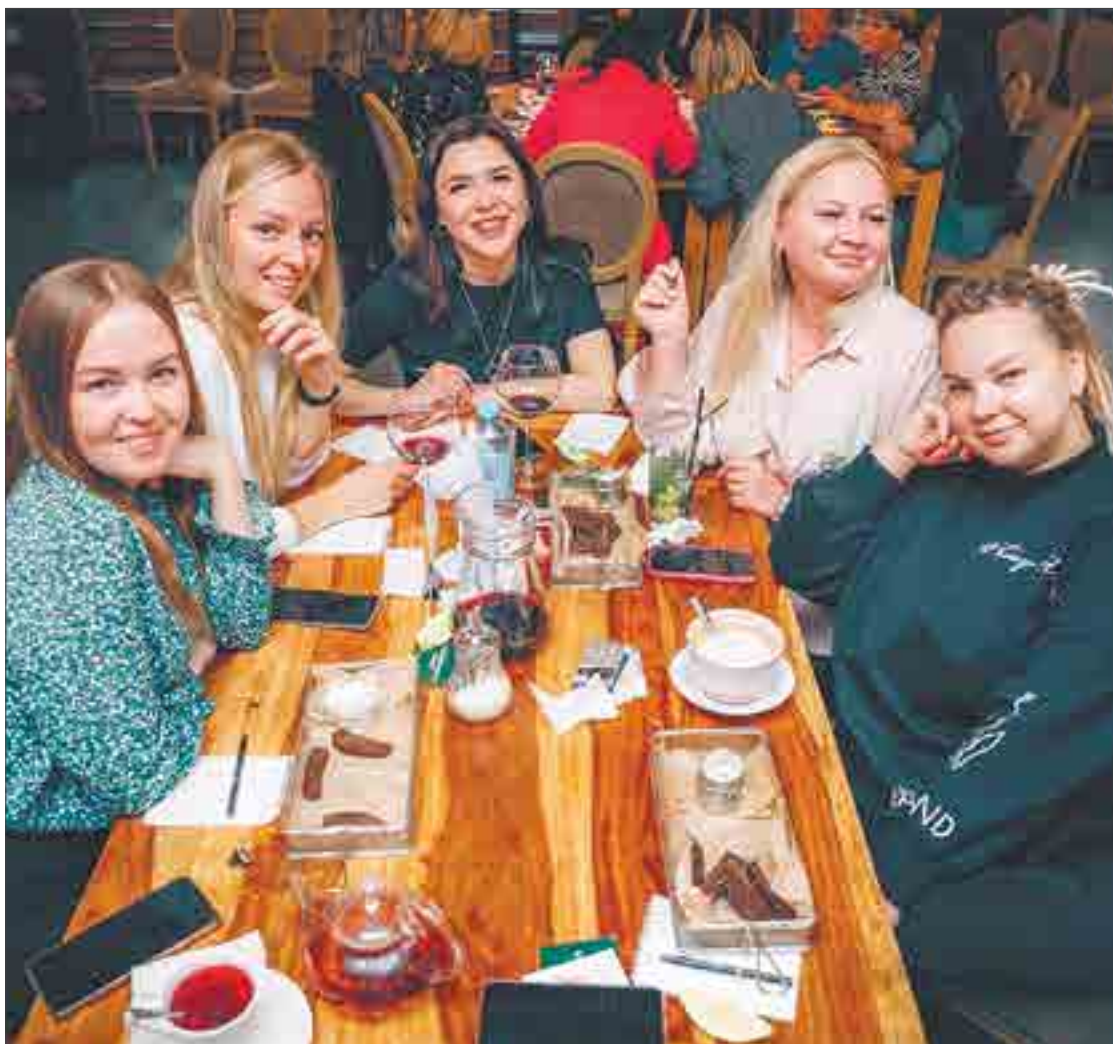
На наших играх вы можете не только проверить свою интуицию, но и вкусно покушать.

Газета «Ревдинский рабочий» является информационным партнером игр разума IMOM'S.