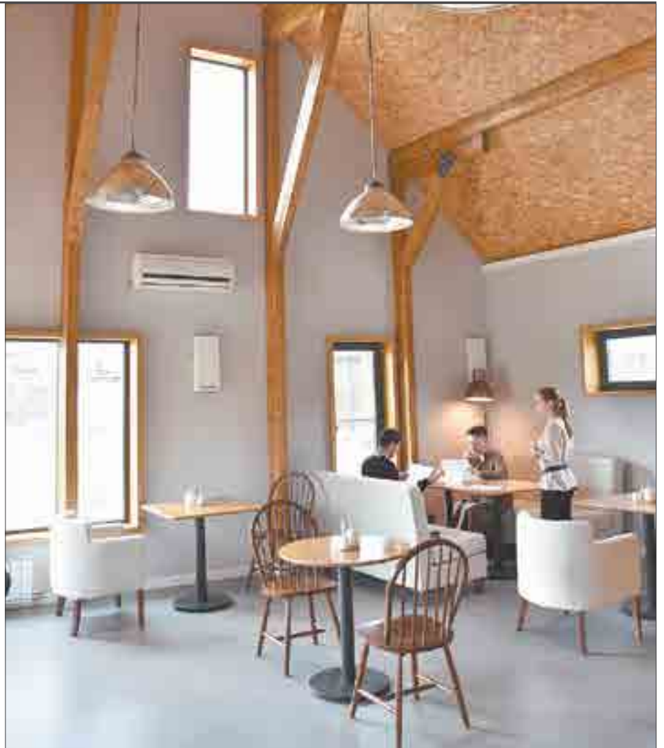
Вот так сейчас внутри. На диваны еще надеты чехлы, а также наполняют интерьер разным декором.

— Мы хотим открыться полноценно, — объясняет Олег Игоревич.