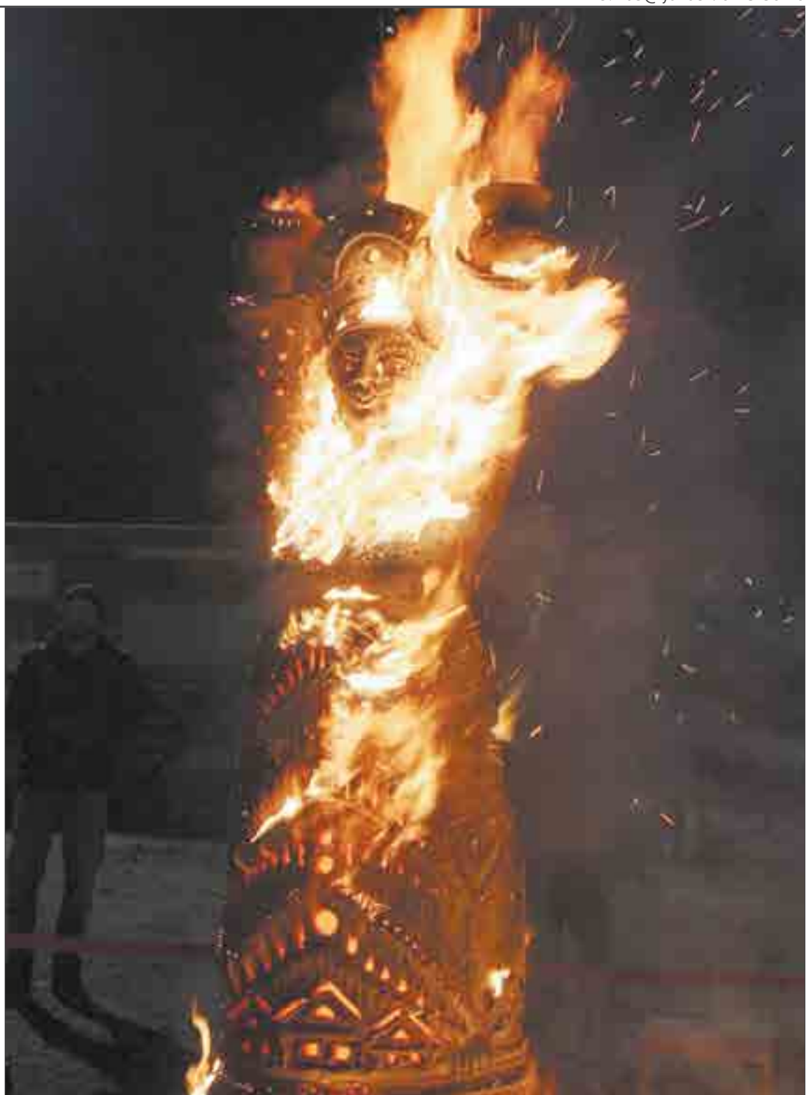
Вот так эффектно горела глиняная Мария.

Все желающие могли посетить выставку в арт-галерее. Сложно представить, что раньше здесь был настоящий коровник. Помимо картин, наше внимание привлекли наличники с окон старинных домов, выстроенных вдоль стен. Выглядело это все довольно впечатляюще.