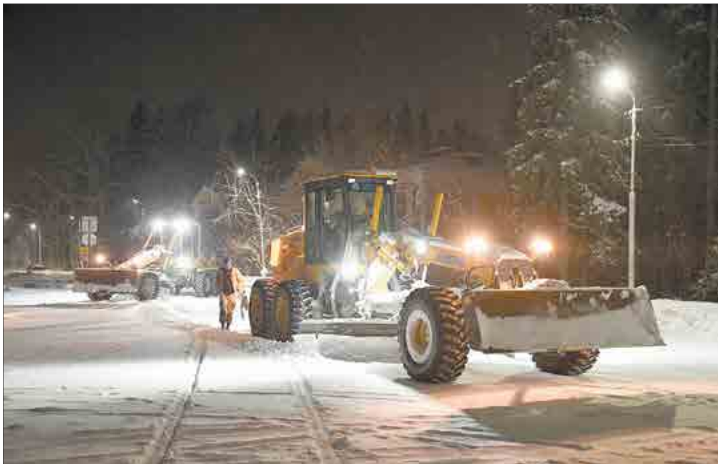
В этом году зимний контракт снова будет выполнять «Армада».

Все наши требования, как заказчиков, они выполняют. Есть какие-то рабочие моменты, не без этого, бы-