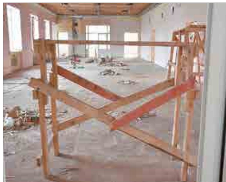
В рекреации второго этажа оборудуют дополнительно один кабинет, в котором расположится Центр детских инициатив.

— Движение есть, — признается директор. — По-хорошему, если взяться всем разом и начать ударно все делать, то можно успеть. Лично я очень переживаю за этот капремонт, иногда спать не могу. Хочется, чтобы быстрее наши дети и педагоги вернулись в родные стены и продолжили учиться. Конечно, учебный процесс идет, спасибо администрации школ №1, 2 и 25-й гимназии за то, что