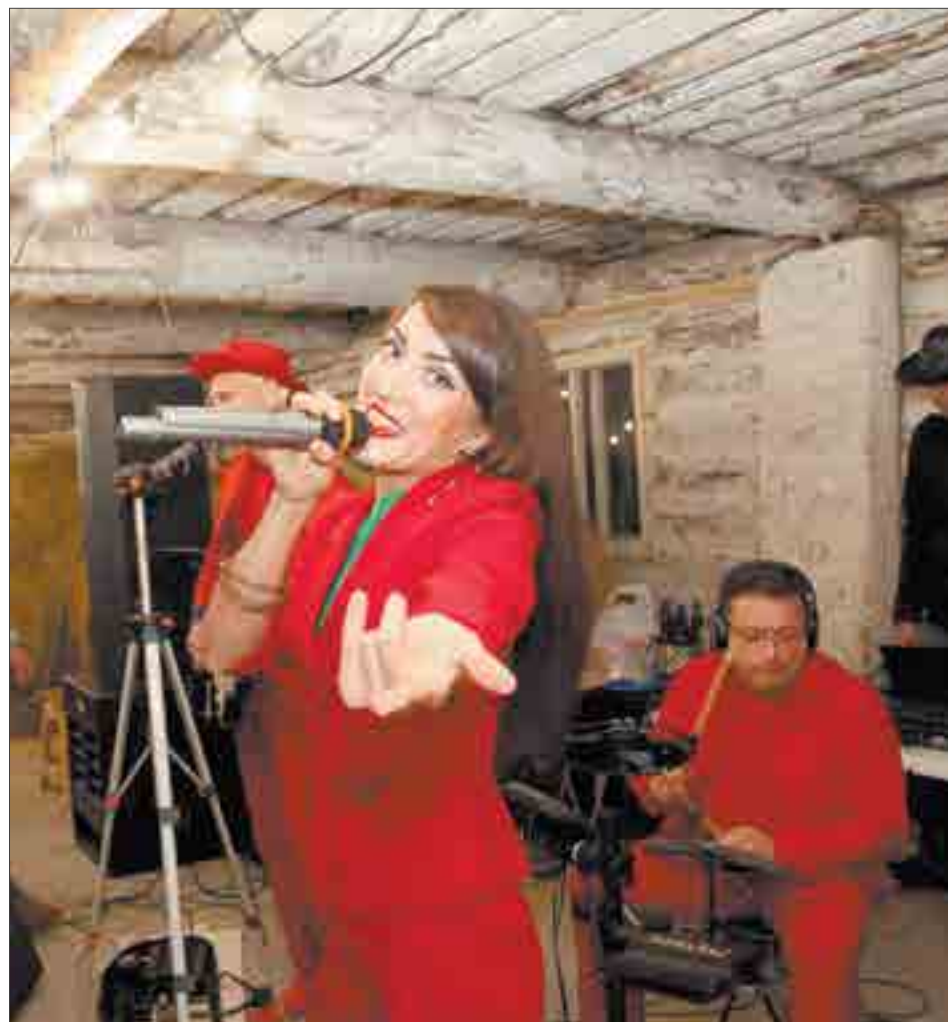
За музыкальную часть праздника отвечала кавер-группа «Томат».