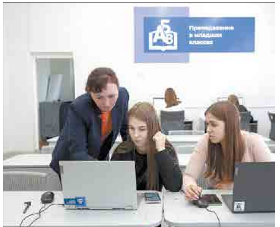
Это Центр демонстрационного экзамена. Но здесь проходят и обычные пары. Например, «Основы финансовой грамотности».