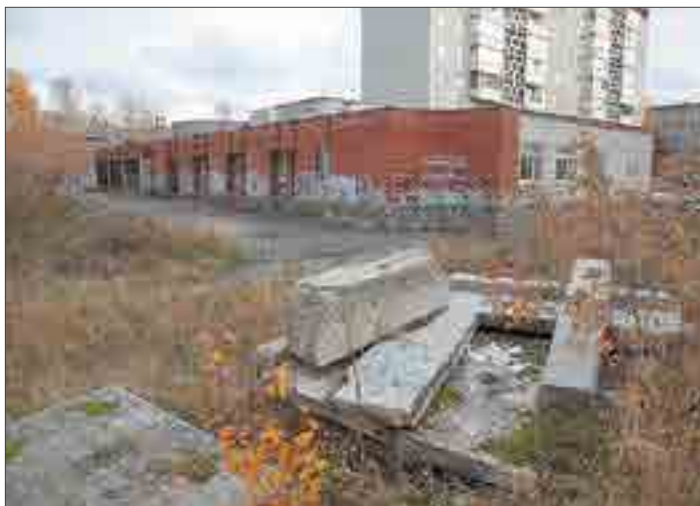
Сейчас огромная территория рядом с художественной школой заросла бурьяном и завалена бетонными плитами.

— Я просила, чтобы здесь проредили кусты, — рассказывает Анна Софьиная, — чтобы хотя бы все эти асоциальные элементы тут не так вольготно себя чувствовали рядом с нашей художкой, но даже этого не могу добиться.