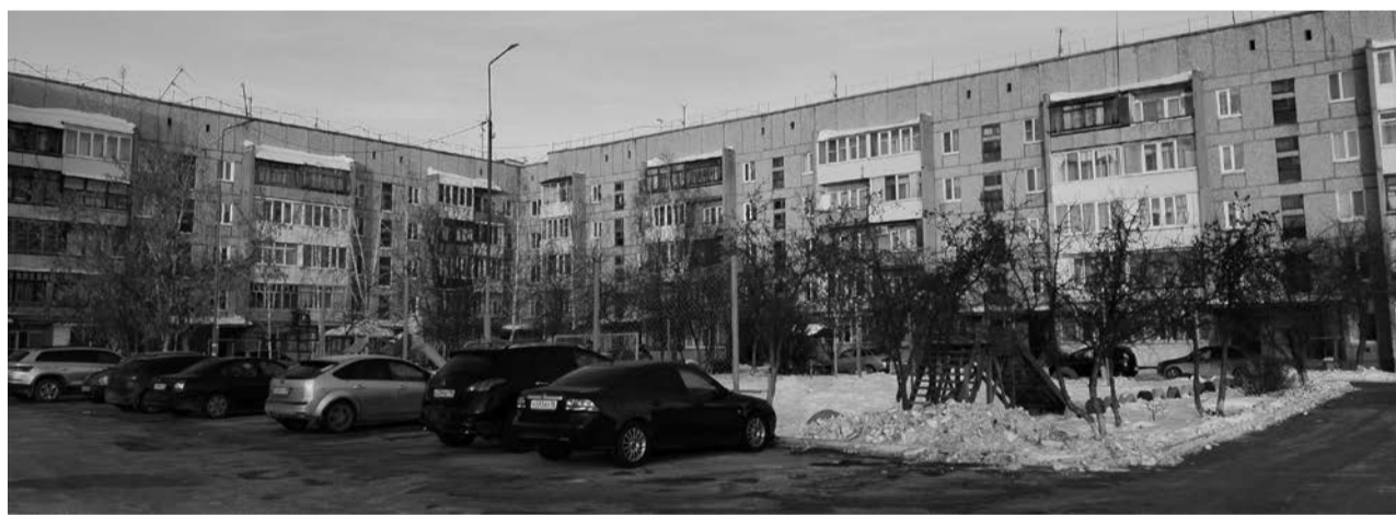
г. Талица, ул. Рябиновая, 4. 3-комнатная квартира выставлена на продажу за 2 миллиона 950 тысяч рублей (48 361 руб./1 м 2 ).