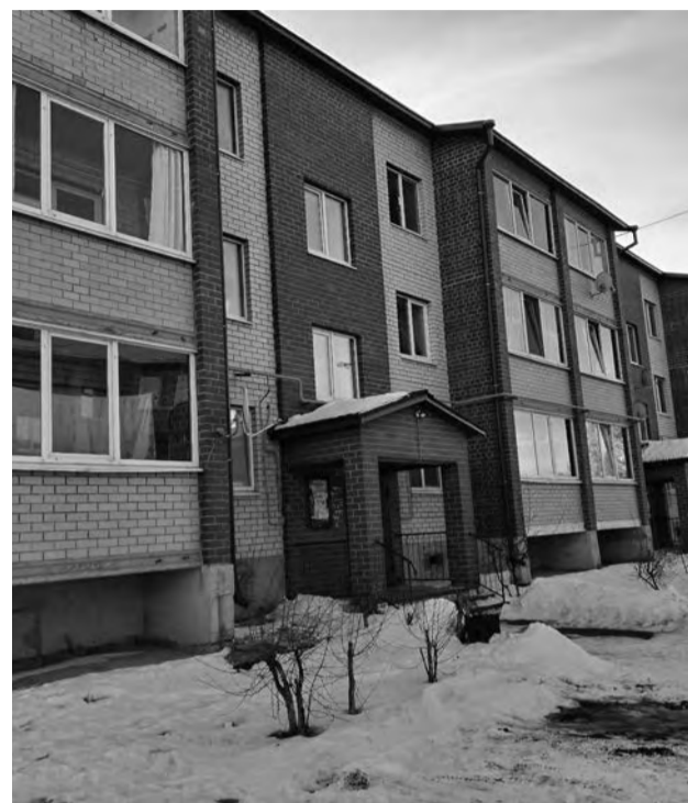
г. Талица. Ул. Песчаная, 12. В этом доме продается 1-комнатная квартира за 2 миллиона рублей (58 997 руб./1 м 2 ).

На таком скачке цен сказались, безусловно, введенные санкции и, как следствие, дефицит импортного оборудования и комплектующих к нему, стремительное подорожание строительных материалов, рост цен на доставку, проблемы с логистикой. Если оглянуться назад, то мы вспомним, что даже на розничном рынке стоимость стройматериалов росла как на дрожжах. К примеру, стоимость цемента со 198-ми за мешок 50 кг выросла до 480 рублей. Конечно, рынок недвижимости на первичке напрямую ощутил на себе такой скачок цен и отреагировал повышением стоимости 1 м 2 нового жилья. Оно и понятно, в минус никто строить не будет. Но на конец уходящего года официальная стоимость «квадрата» увеличилась снова. В процентах вроде бы и не много, всего на 16,7%. Но цена перевалила уже за сто тысяч рублей за 1 м 2 . 22 декабря 2022 года Приказом Минстроя для Свердловской области утверждена стоимость 1 м 2 общей