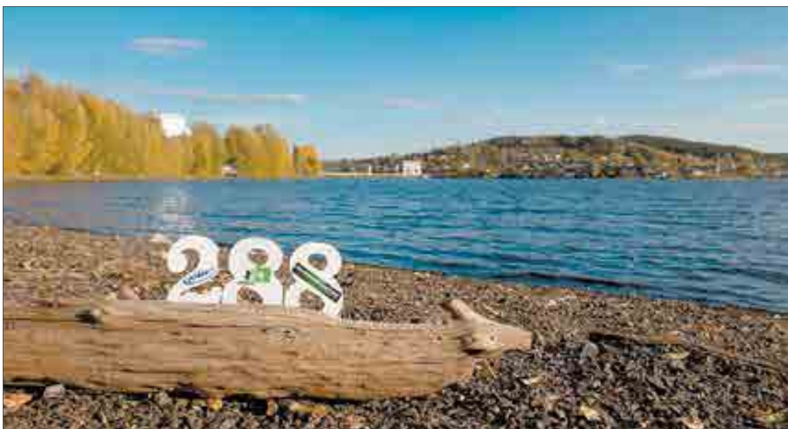
Автор фото — Алина Щекотова. Она подготовила цифры, поместила на них наши логотипы и герб города. И поглядите, какой классный ракурс выбрала. Мы сразу влюбились в это фото!

Признаемся, работ на конкурс мы получили немного. Возможно, сложность вызвала необходимость заветной цифры в кадре. И предпочтения отдавали именно рукотворной 288 в кадре, а не помещенной на фото в фоторедакторе (таких работ было большинство — мы им тоже говорим спасибо, ведь люди старались). В итоге мы выбрали три фото. И их авторы получают от НЛМК-Урал фирменные футболки!