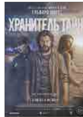
ХРАНИТЕЛЬ ТАЙН Испания, Германия 18+ триллер

Девочка Нина жила совершенно обычной жизнью — ходила в школу, играла в куклы... Но однажды девочка неожиданно для себя получает чудесную сверхспособность — создавать сновидения других людей. И после этого девочка попадает в новый мир. Попадая в волшебную Страну Снов, она встречается с её весьма необычными обитателями, заводит новых друзей и учится превращать сны в реальность.