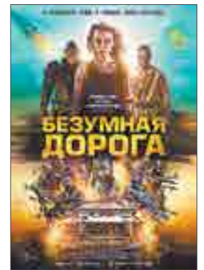
БЕЗУМНАЯ ДОРОГА Австралия 16+ ужасы, боевик

У каждой потерянной вещи есть своя оригинальная история и свои секреты. А у героя этого фильма Марио есть особый талант — раскрывать эти секреты. Однажды к нему попадает чемодан с ледящим душой содержимым. Начав распутывать эту страшную головоломку, он выходит на организацию по торговле людьми. Теперь Марио предстоит пролить свет на происходящее и раскрыть целую преступную сеть.