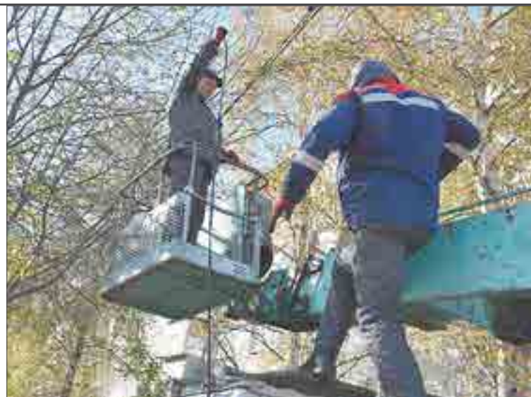
Бригада «Экспресс-Энергомонтаж» нашла обрыв провода на улице Цветников. Но это только полдела. Самое главное — устранить короткие замыкания. А на это, по словам сотрудников, уходит от нескольких часов до нескольких дней.

— Замечаний очень много, больше пятидесяти заявок поступило за первые несколько дней, в каждой — по несколь-