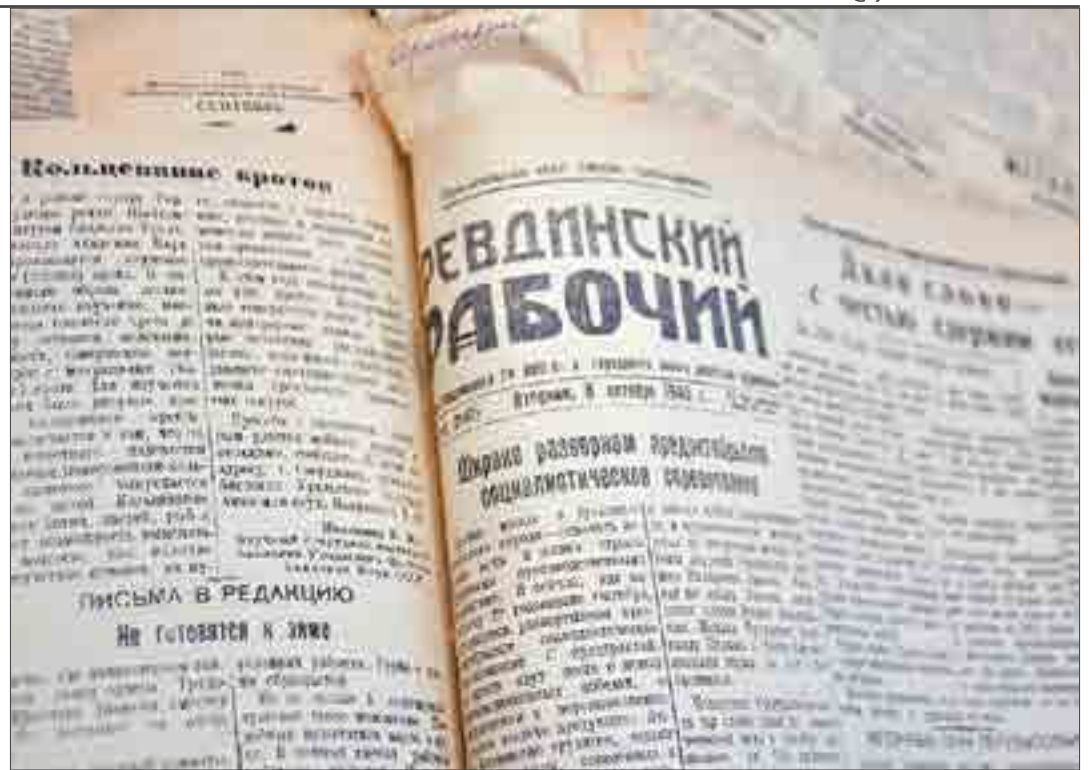
Первая страница газеты «Ревдинский рабочий», выпущенная 8 октября 1946 года.