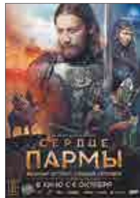
СЕРДЦЕ ПАРМЫ Россия 16+ драма, история