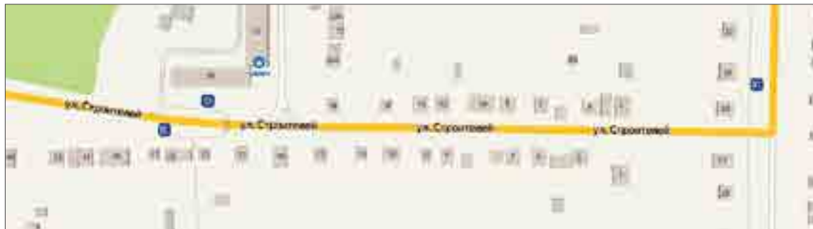
Проблемный участок улицы Строителей находится вот здесь.

— Если я со скандалом вызываю службу вывоза снега, то они вывозят, — сетует Елена. — А так — нет. В контракт на зимнее содержание мы никогда не войдём. Нам все