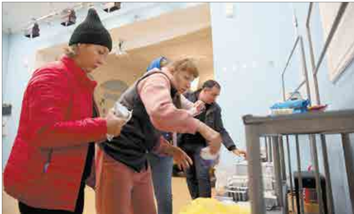
Первые инициативы помощи мобилизованным начали организовывать в четверг. Первыми стали эти женщины — они по своей инициативе накупили для мобилизованных мужчин еды.

— Ешьте лучше сейчас, пока горячее, — говорили на выда-