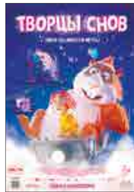
ТВОРЦЫ СНОВ Дания 6+ мультфильм