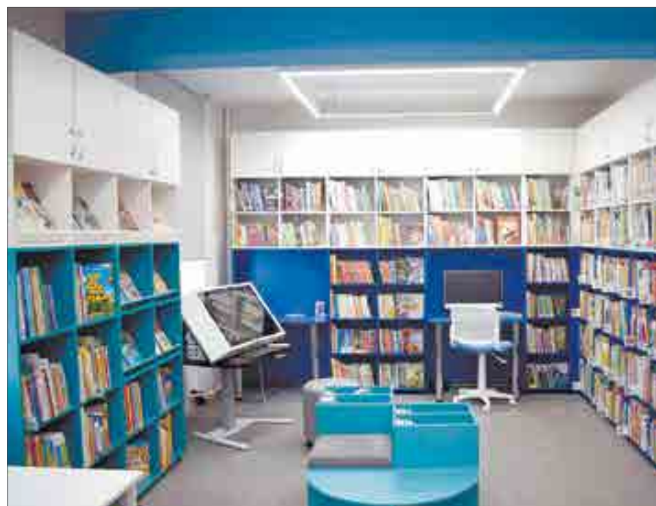
Фото администрации ГО Ревда