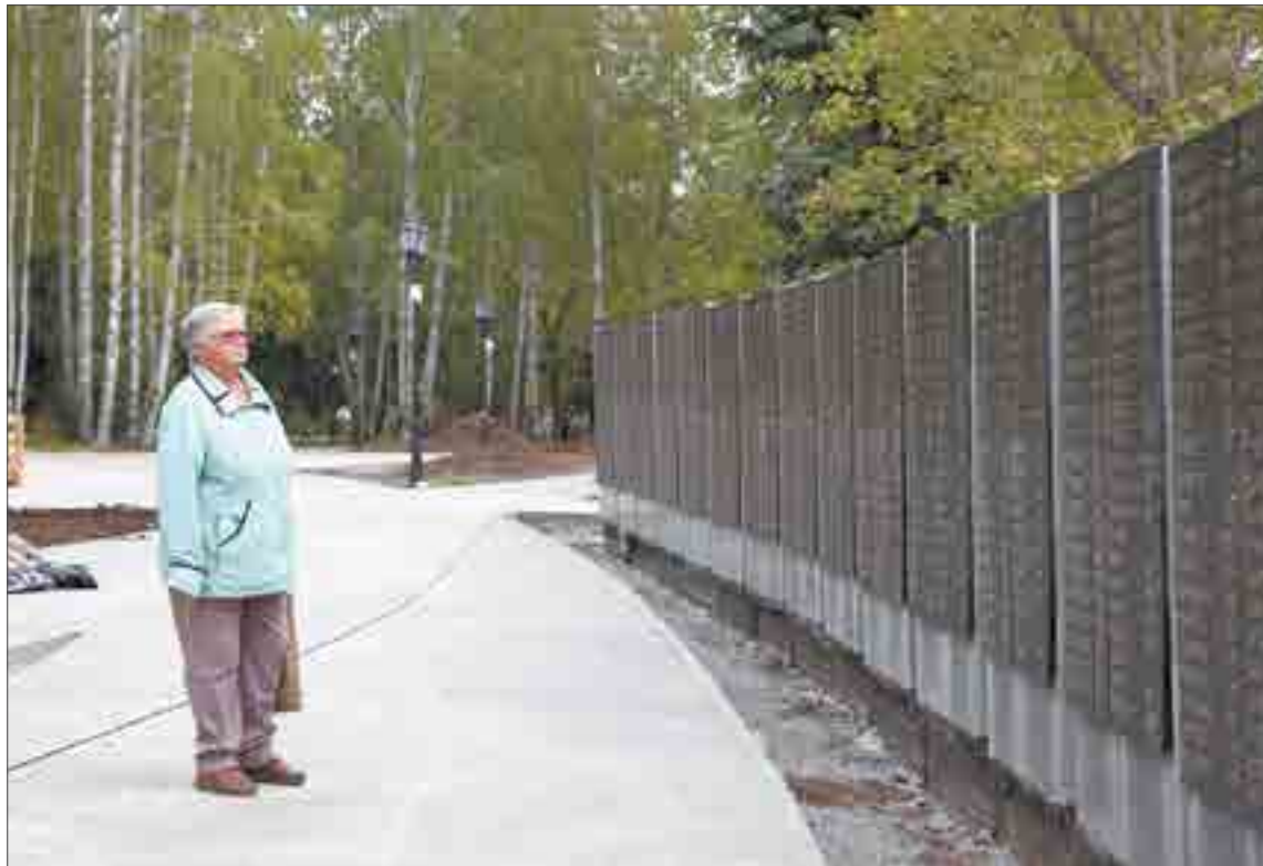
Если вы не нашли фамилию родственника на мемориальной плите или обнаружили, что она написана неправильно, обращайтесь в Управление культуры и молодежной политики.

Сейчас подрядчики будут восстанавливать водопропускную трубу. Кроме того, подбетонят стыки и посеют газон. Сергей Филиппов обратил внимание подрядчиков на то, что отсутствуют заглушки на некоторых секциях