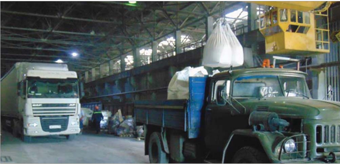
Автомобильный транспорт загружают в порядке очереди.

Разменена вторая декада января. На складах снуют погрузчики, заезжают-выезжают фуры, машинисты мостовых кранов чётко выполняют команды «вира» и «майна»... За всеми процессами внимательно следят специалисты отдела комплектации и отгрузки.