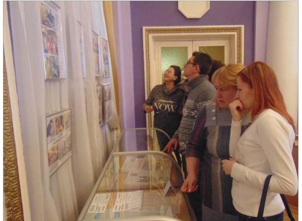
На выставке к 25-летию газеты. 2019 год.

внештатных корреспондентов, начальнику ИВЦ – изыскать возможность обеспечения редакции газеты компьютером и организовать обучение. Главным специалистом АО «Динур» - предоставлять в газету материалы командировок, выступлений на совещаниях, семинарах и конференциях.