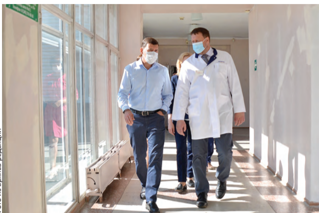
Как выполняются поручения в поликлинике №3, губернатор проверил лично

или иных населенных пунктов, где рядом газопровода сейчас нет, могут специально сделать проект, если большинство жителей подтвердит желание газифицироваться. Также известно, что в регионе большой перечень льготников, кому при подключении компенсируют почти 75% стоимости газового оборудования.