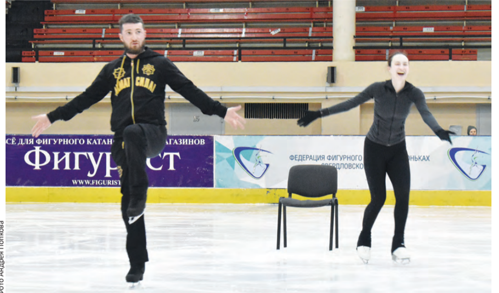
Опа! Вытащили Кашея со стула... ой, с трона!

– «Приключения Маши и Вити», если говорить о том, сколько занято человек, не такие масштабные, как, допустим, «Приключения Буратино», всего чуть больше 30 участников. Но столько людей захотели принять участие, что пришлось придумать для них массовую