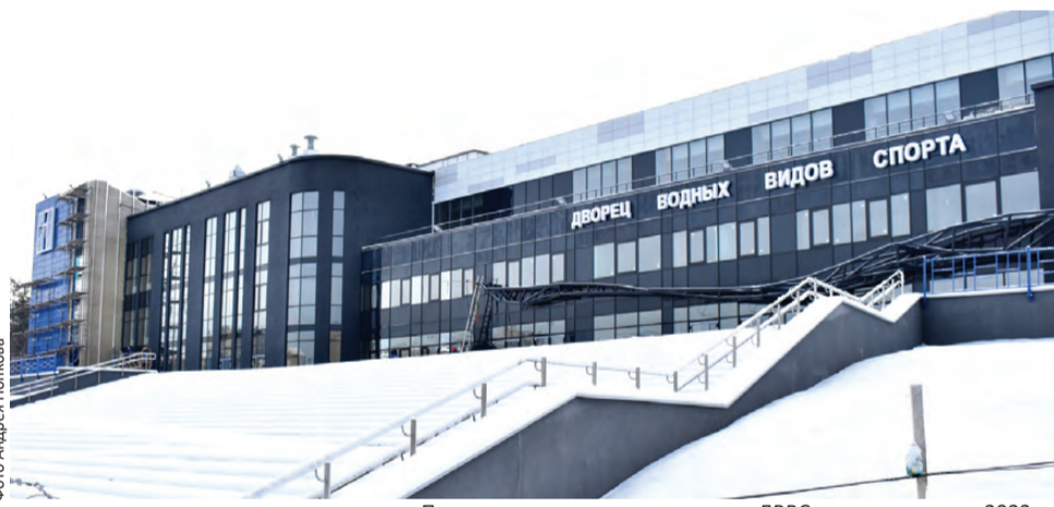
Предполагается, что для горожан ДВВС откроется летом 2023-го