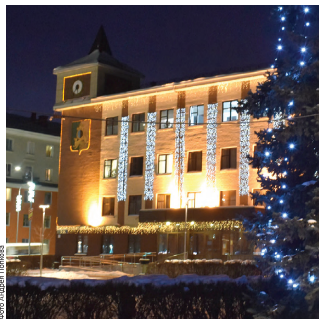
Здание администрации украшают гирлянды