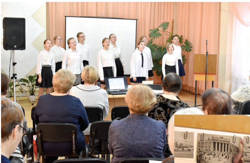
Музыкальное начало «Шайтанских чтений»