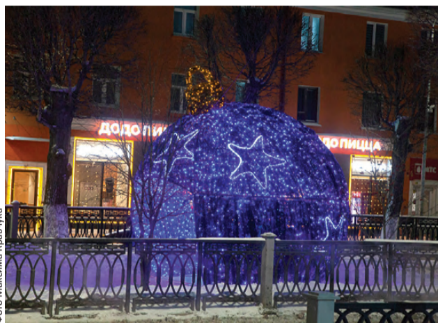
Таковую игрушку на елку не повесить!

Далее, по-новогоднему оформили и набережную Нижнего