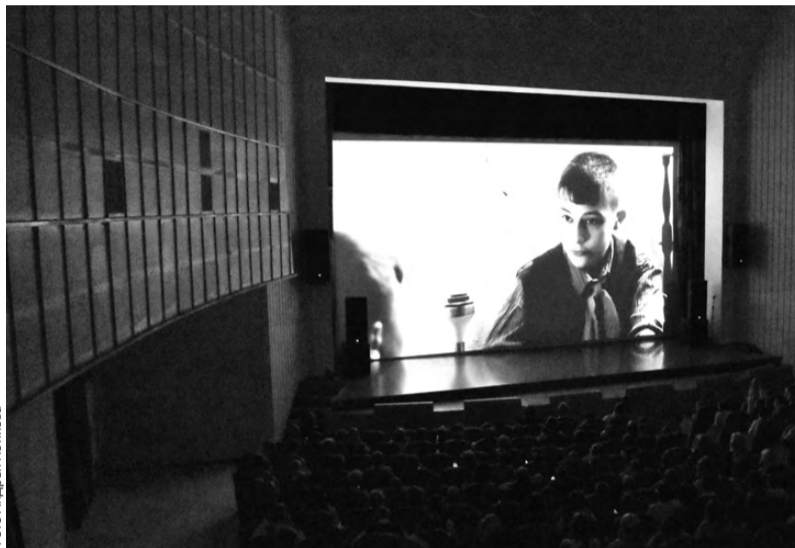
От тяжелых мыслей героям фильма помогли отвлекаться общение и игры

В Первоуральске фильм «Тень Каравеллы» демонстрируется не впервые. В 2021 году презентация картины состоялась в кинотеатре «Восход», тогда его зрители стали учащиеся и учителя лицея №21, школы №4, а также ветераны-новотрубники, теперь же – ребята из школы №6.