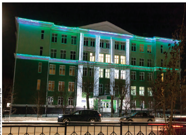
Аллея на проспекте Ильича – еще одна точка на карте новогоднего убранства

Первоуральск уже в новогодних огнях! Центр города смотрится просто волшебным. Здесь появились не только знакомые украшения, но и новинки сезона.