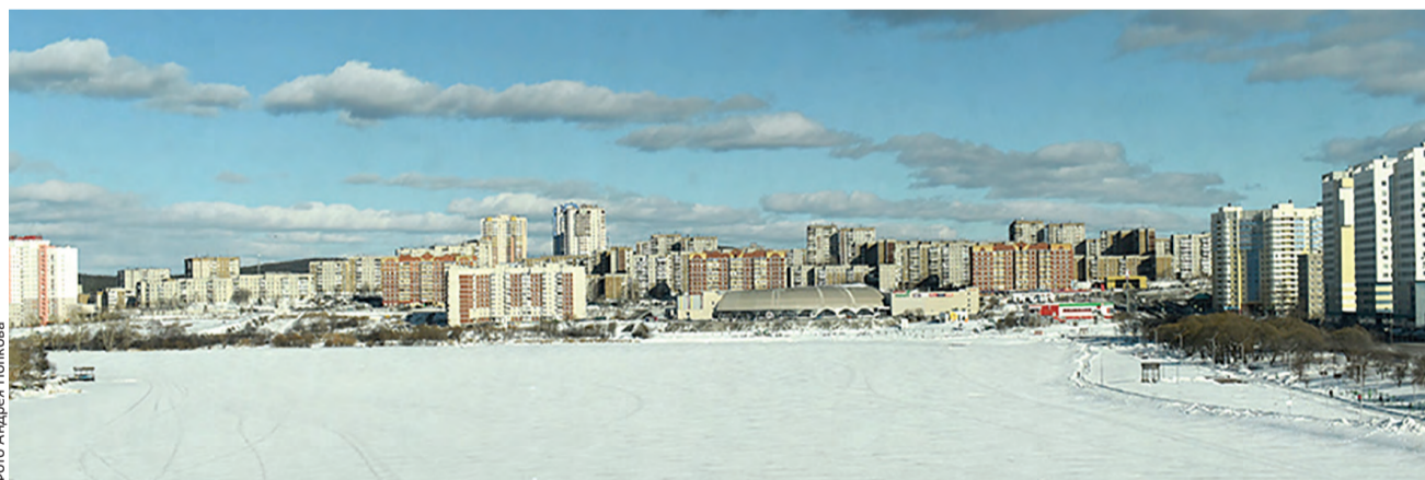
Очередной этап: набережная вновь в списке претендентов на благоустройство

Помимо голосования для участия Первоуральска в конкурсе по благоустройству стартовал и первый этап уже привычного голосования – за территорию, которую благоустроят через год. В списке значатся 15 объектов. До 15 февраля жители городского округа должны определить 5 территорий, которые затем будут включены в рейтинговое голосование.