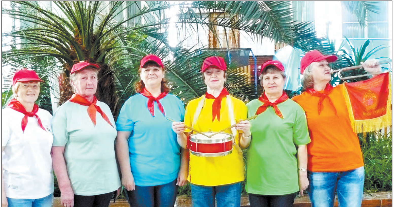
Отряд «Веселые ребята», с. Бараба

Вся школа - одна дружина. Каждый класс - это пионерский отряд. Каждый пионерский отряд выбирал представителя в Совет дружины. Это были достойные, ответственные, надеж-