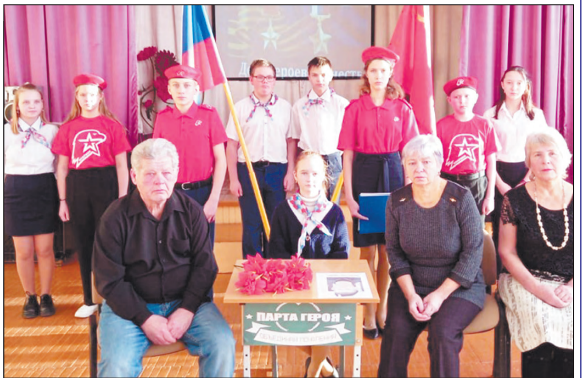
— День Героев Отечества в селе.