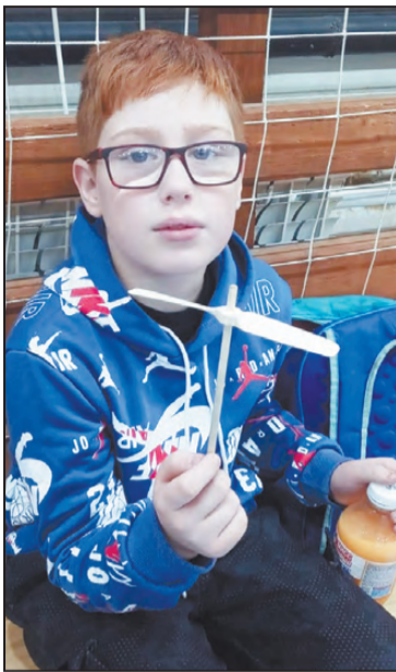
С вертолетом «Муха»

Даже простейшая модель вертолета сделает изобретателем