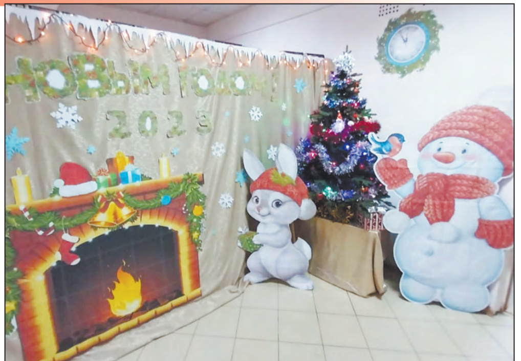
В гостях у магазина