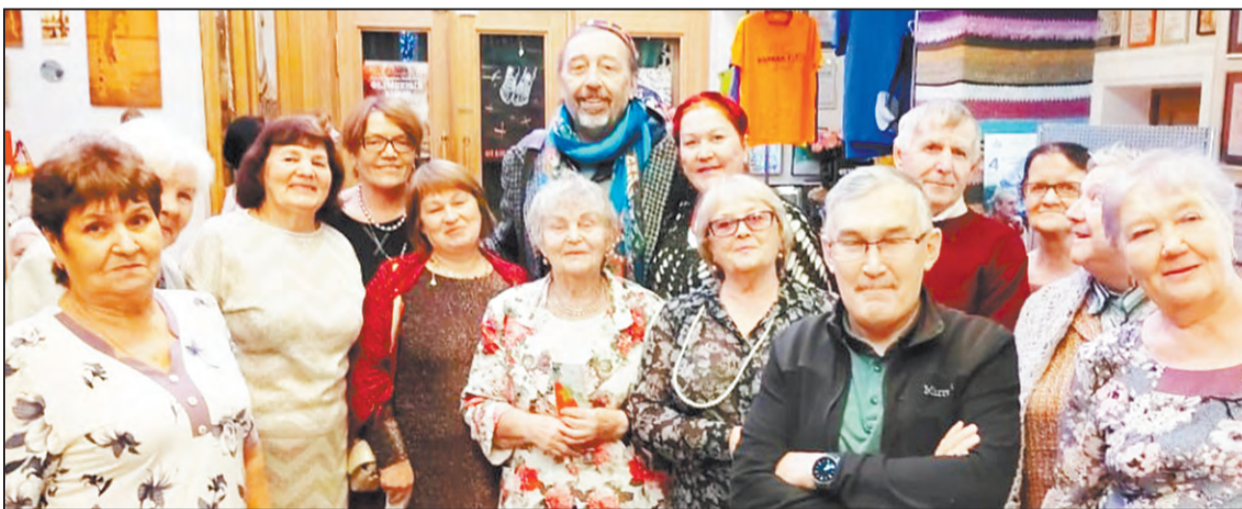
С Николаем Колядой (в центре)

В декабре пенсионеры Артинского завода побывали в «Коляда-Театре» г. Екатеринбурга на спектакле-комедии «Не включай блондинку». Какие остались впечатления? Конечно, много слышали об этом театре и его художественном руководителе Николае