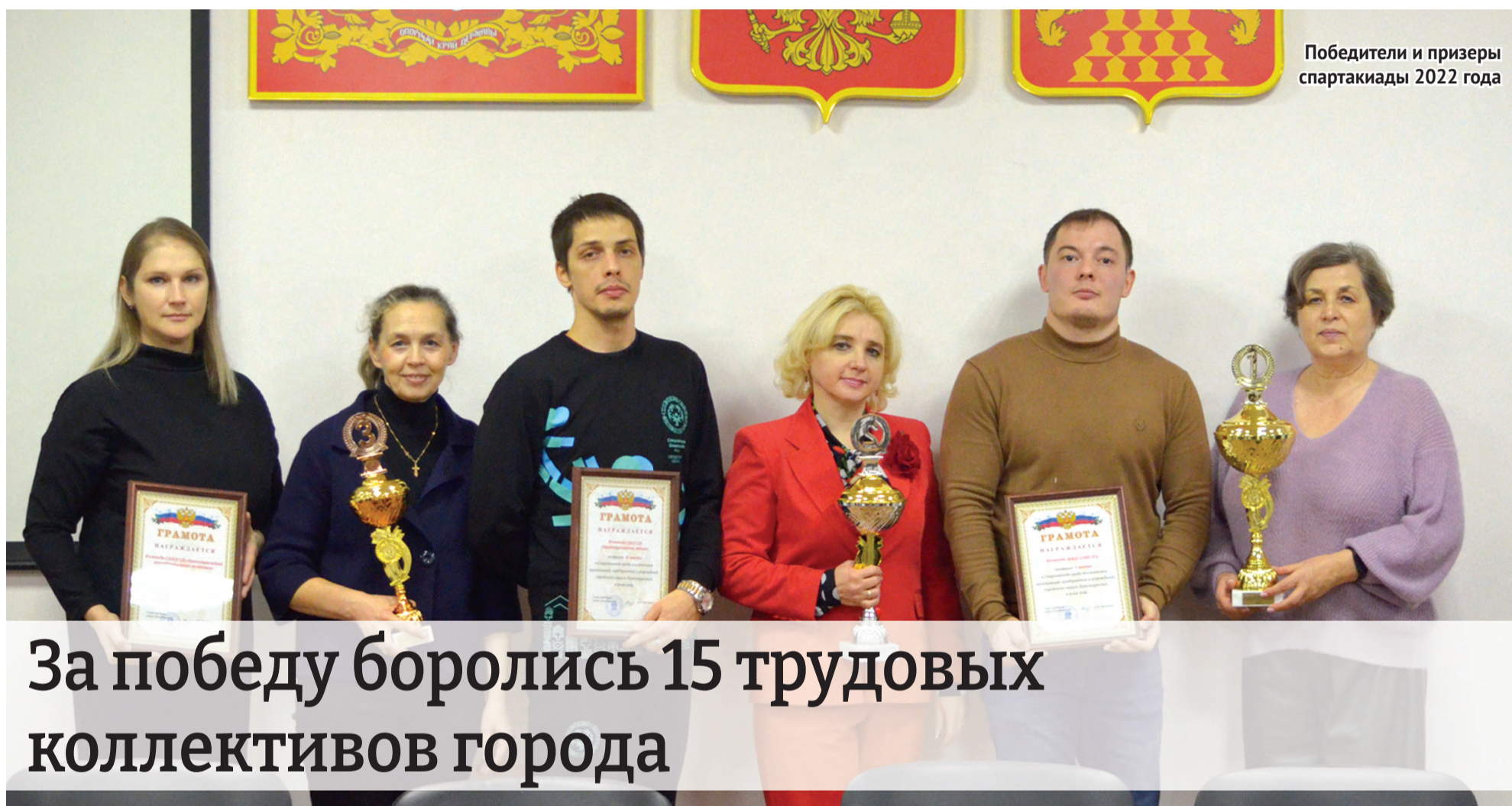
Победители и призеры спартакиады 2022 года