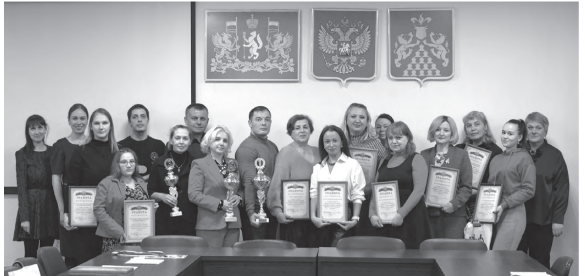
Представители команд – участниц спартакиады среди организаций, предприятий и учреждений Красноуральска