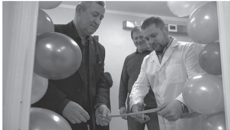
Торжественное открытие кабинета флюорографии

В торжественном пуске новой техники наряду с сотрудниками больницы приняли участие и представители градообразующего предприятия – заместитель директора по социальным и об-