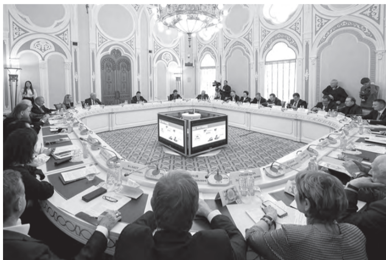
Заседание региональной Общественной палаты

Евгений Куйвашев назвал конкурс «Достояние Среднего Урала» знаковым проектом для всей Свердловской области. На итоговом в 2022 году заседании региональной Общественной палаты 27 декабря губернатор с уральскими общественниками, добровольцами и экспертами подвели итоги конкурса и назвали первых обладателей высокого статуса.