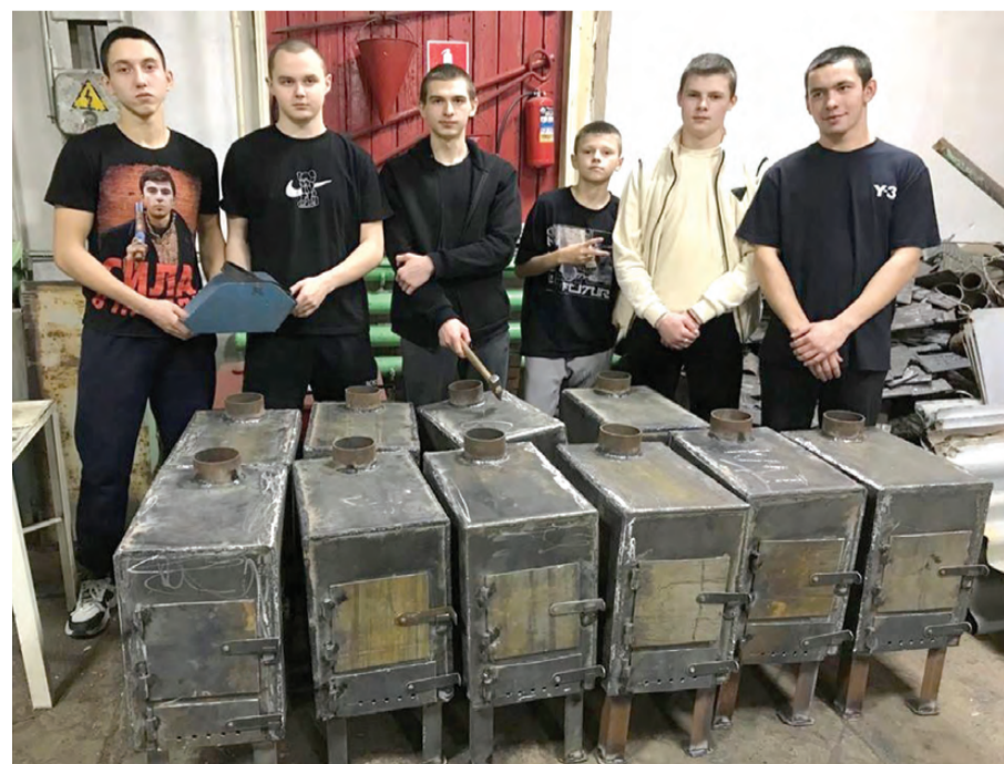
Студенты-волонтеры 110 гр. КМТ с изготовленными буржуйками