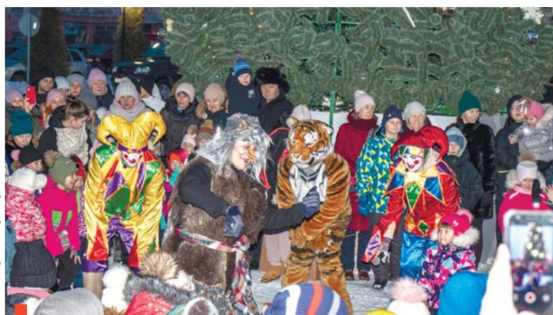
На праздник пришли сказочные «злодеи» – Баба-яга и Тигр