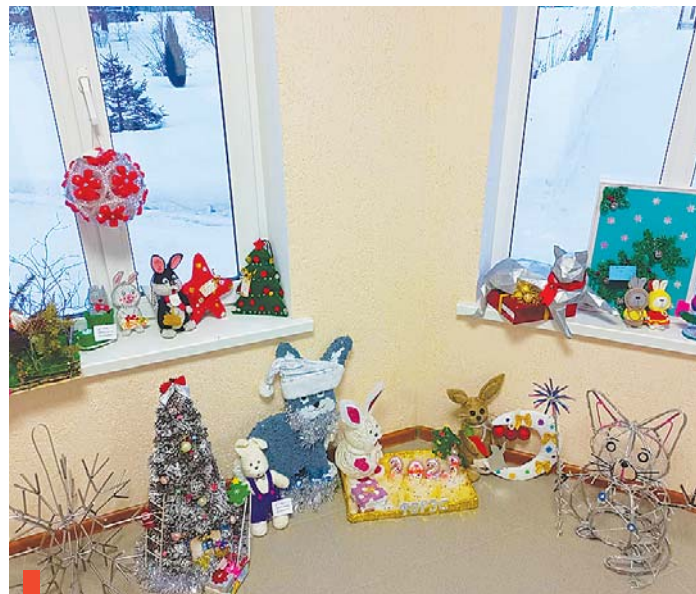
Творчество сотрудников Курьинского обособленного подразделения