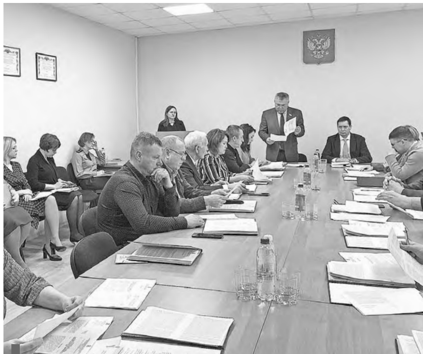
Последнее в 2022 году заседание Думы состоялось 22 декабря

Разработку проектно-сметной документации планируется выполнить в 2023 году.