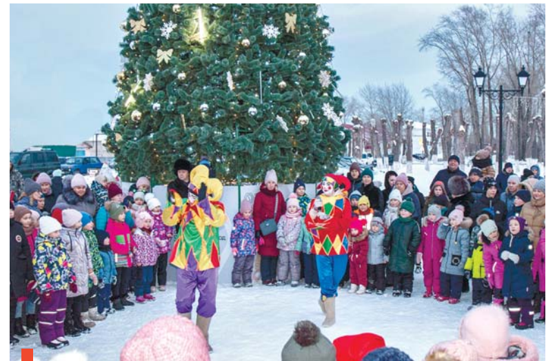
Сказочное действо открывают Скоморохи

Городок с шикарной елкой у огнеупорного завода появился почти месяц назад. Ярких, активных, творческих жителей он притягивает площадкой для фотосессий. А для детей работников предприятия накануне Нового года здесь развернулось театрализованное представление и игровая программа с Дедом Морозом, Снегурочкой и сказочными героями. На дебютный праздник у зеленой красавицы пришло более 500 гостей.