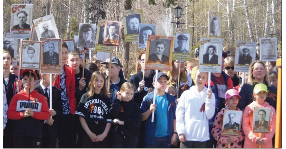
В «Бессмертном полку».

На участке неформованных огнеупоров первого цеха освоили выпуск нового вида лётной массы для Нижнетагильского меткомбината с учётом всех требований потребителя. Поднять производитель-