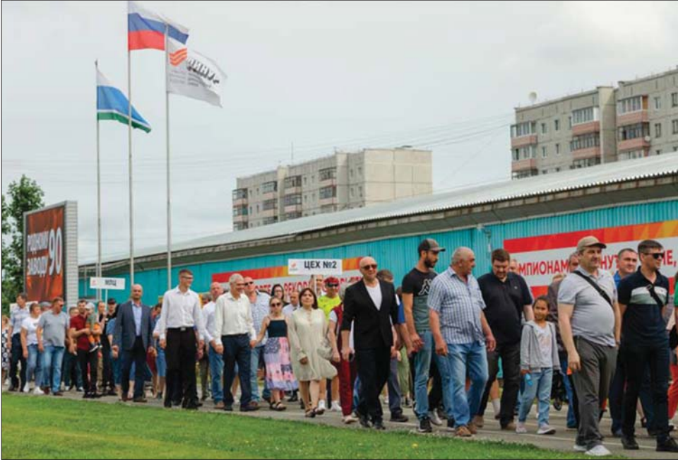
Парад в честь 90-летия завода.

Каждый год имеет свои черты и особенности. Уходящий – тоже с особым характером. Ещё немного, и события, произошедшие за двенадцать минувших месяцев, станут следующей страницей заводской истории. О чём огнеупорщики будут говорить: «Это было в 2022-м»?