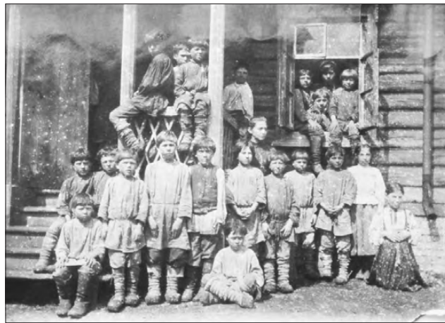
Земская школа в селе была открыта 15 января 1873 г.