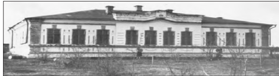
Вновь отстроенная на средства государства кирпичная школа была открыта в 1907 г.