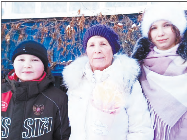
Н.В. Мизгирева с волонтерами