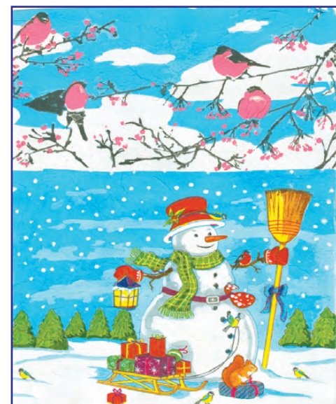
На конкурс «Рисунок Деду Морозу» Ангелина Сурнина, 9 лет, школа №6, 3 кл.