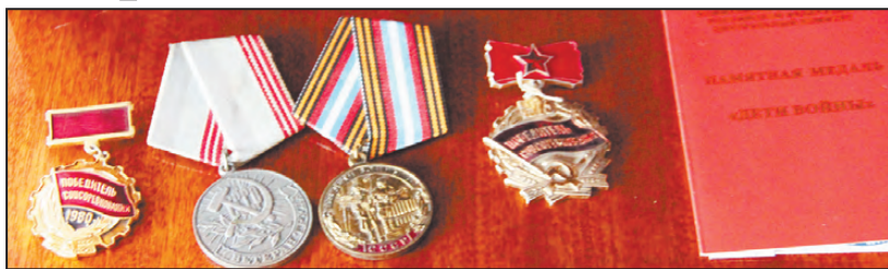
Награды ветерана труда