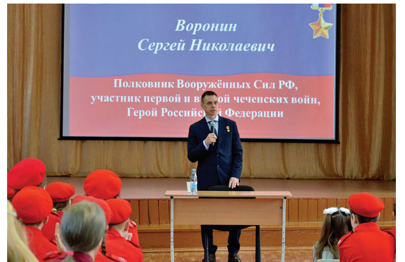
С.Н. Воронин в школе №6

Герой Российской Федерации – почетное звание, высшая степень отличия в Российской Федерации. Учреждено Законом РФ от 20 марта 1992 года. Награждение производится за заслуги перед государством и народом РФ, связанные с совершением героического подвига (в том числе посмертно), за трудовые заслуги и достижения в области спорта. При награждении вручаются медаль «Золотая Звезда» и грамота.