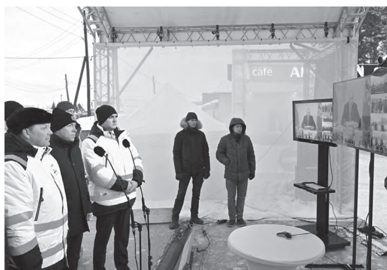
Евгений Куйвашев на церемонии открытия

Губернатор Свердловской области Евгений Куйвашев 13 декабря принял участие в церемонии открытия новых и реконструированных объектов транспортной инфраструктуры, проведенной в режиме видеосвязи президентом России Владимиром Путиным. В Свердловской области открылся после реконструкции участок дороги на трассе Екатеринбург – Тюмень.