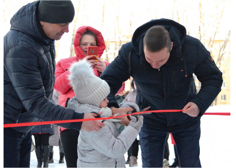
Разрезание красной ленты

Напомним, расселение граждан из аварийного жилфонда осуществляется в рамках национального проекта «Жилье и городская среда» и Федерального закона №185-ФЗ. Согласно ст. 2 закона №185-ФЗ, в программе переселения принимают участие жилые помещения в многоквартирных домах (МКД), признанных аварийными и подлежащими сносу или реконструкции до 1 января 2017 года. Причиной