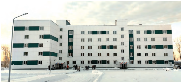
Новый 78-квартирный дом по ул. Чехова, 17