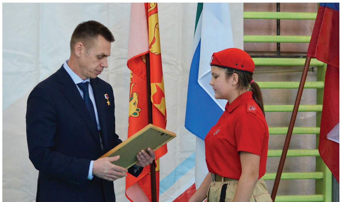
Вручение свидетельств о вступлении в юнармейское движение