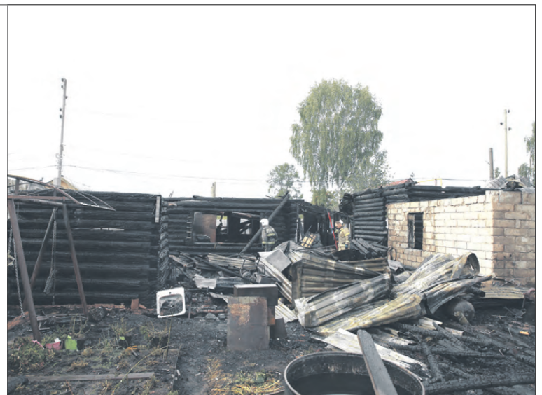
В пожаре на Возмутителей сгорели сразу два дома — 96 и 96а.

У семьи трое детей: мальчик 8 лет, девочки 12 и 16 лет. Сейчас они остро нуждаются в канцелярских товарах (вот-вот начнется учебный год), а также детских зимних вещах. У восьмилетнего мальчика рост 146