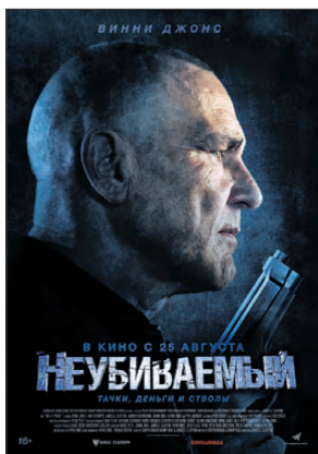
«НЕУБИВАЕМЫЙ», (КАНАДА), 16+, БОЕВИК