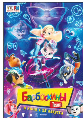
«БАРБОСКИНЫ ТЕМ» (РОССИЯ), 0+, МУЛЬТФИЛЬМ, МЮЗИКЛ