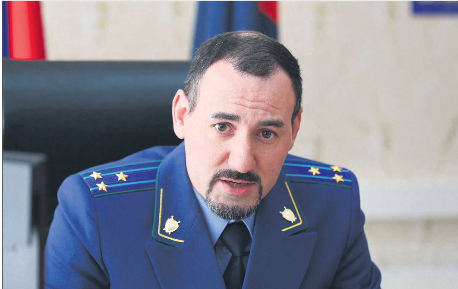
Новый прокурор очень доволен коллективом, с которым будет работать. Сказал, что в нашей прокуратуре работают настоящие профессионалы.

Для меня Ревда — не случайный город. Когда я работал в прокуратуре Свердловской области в отделе по надзору за соблюдением законодательства в сфере экономики, то отвечал также и за надзор над Ревдой — у нас есть понятие зонального принципа, соответствующий сотрудник не только занимается своим предметом, но и осуществляет надзор в от-