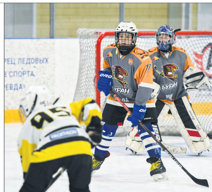
Первый состав «Бурана» занял третье место в турнире.

В «Гонке ГТО» победителя определяли по сумме очков за все пройденные испытания. Первое место заняла команда «Секта банда», второе — «Мы от тренера», третьими стали «Барбоскины».