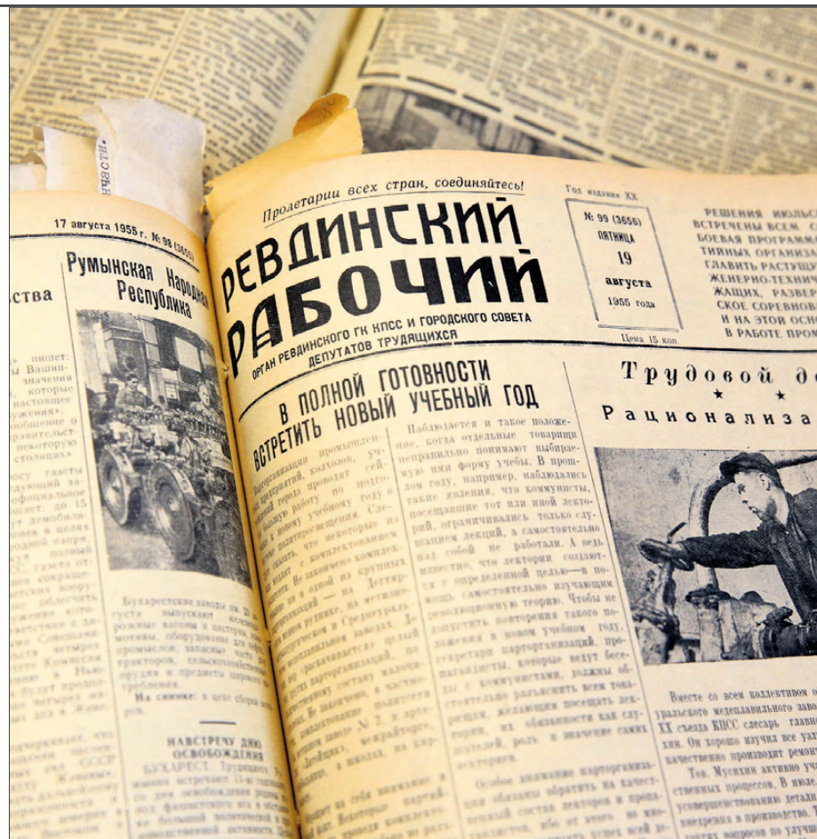
Рабочая обложка газеты, с отчетами о проделанном и отличившимся работниками.