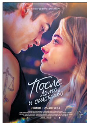
«ПОСЛЕ. ДОЛГО И СЧАСТЛИВО» (США), 16+, ДРАМА, МЕЛОДРАМА