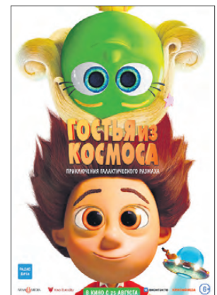
«ГОСТЬ ИЗ КОСМОСА» (ДАНИЯ), 6+, МУЛЬТФИЛЬМ, СЕМЕЙНЫЙ

Вор совершает возможно главное ограбление всей своей жизни, уведя деньги психопата-наркобарона Темпла. Но тут он обнаруживает в машине беременную жену Темпла Мию. Разъяренный Темпл преследует Вора, а тот разрывается между желанием залечь на дно и рискованным планом помочь Мии вырваться из жестоких объятий мужа. Их единственный шанс остаться в живых — уйти от погони.