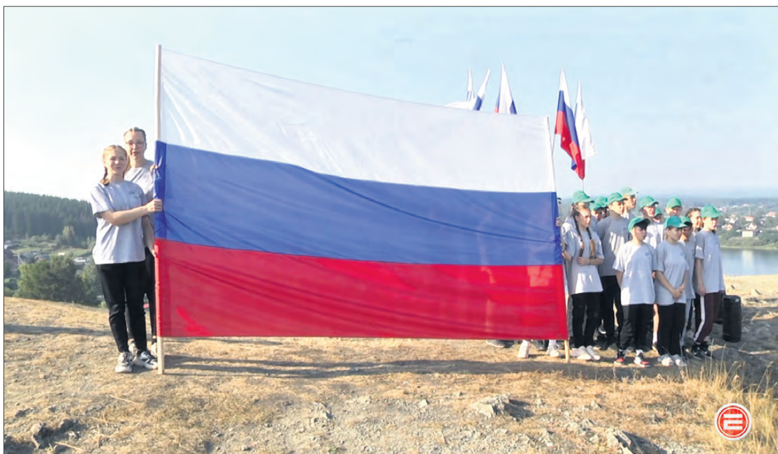
Так выглядел флэшмоб вблизи.

Его приурочили к Дню государственного флага