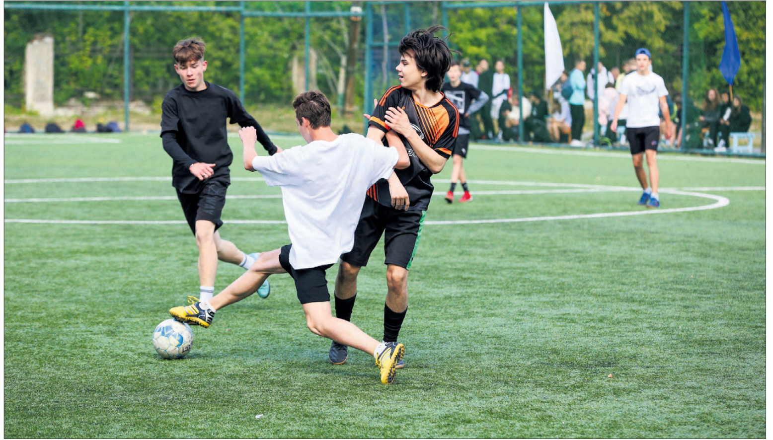
Несмотря на то, что это детский турнир, тренеры признаются, что смотреть его было интереснее, чем большой футбол.

Регламент турнира был следующим. Есть шесть команд, которые разбиваются на три турнирные пары. После первых трёх игр остаются три финалиста и играют каждый с каждым. Кто одержал больше побед, тот и победил. Такой формат проведения избрали