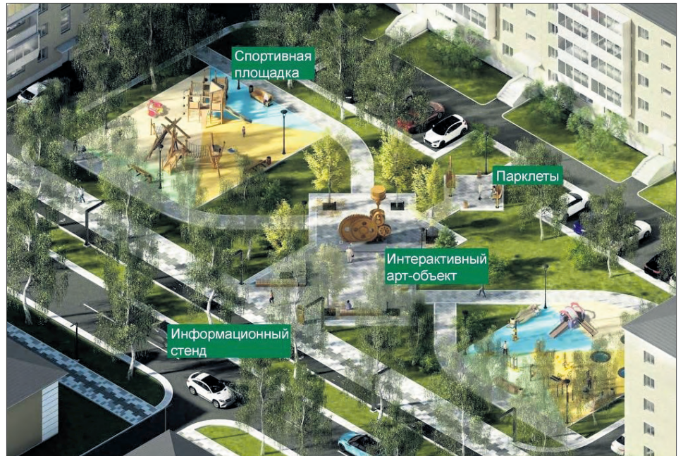
Вот так, по мнению авторов проекта «Чеховский проспект», будет выглядеть одна из будущих общественных территорий. Макет из дизайн-проекта

В окончательном варианте, который и был представлен на конкурс, в следующем году серьезные изменения коснутся участка от улицы Цветников до улицы Павла Зыкина, где появятся новые общественные пространства — Креативный сквер и Тихий дво-