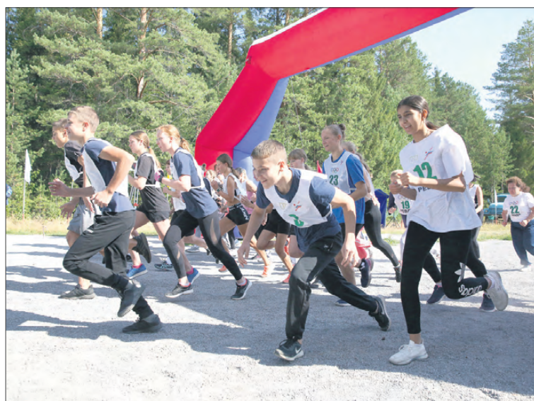
Забег на 3 или 5 км стал самым сложным испытанием на гонке.

Впервые гонку, посвященную Дню физкультурника, устроили в 2016 году. Тогда она проходила более масштабно и носила название «Я смогу». С годами меро-