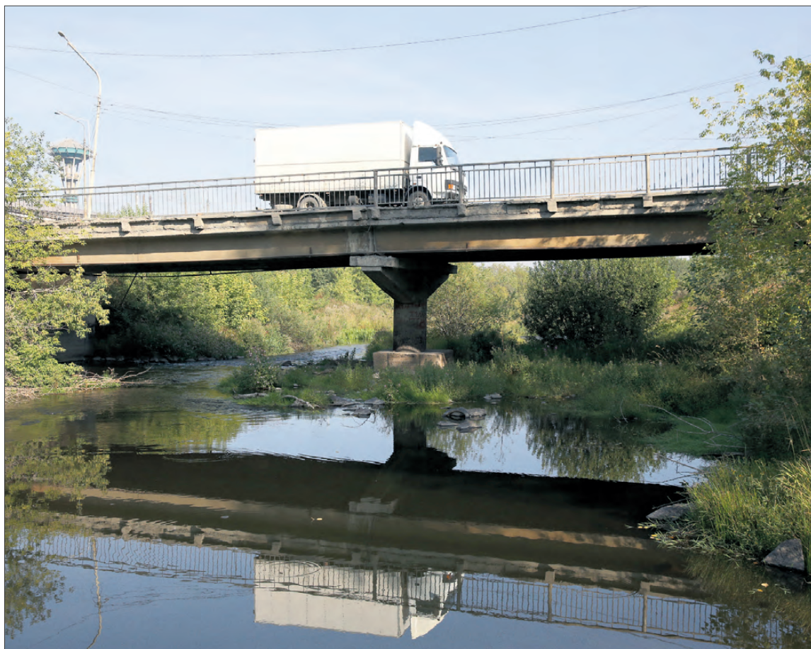
Ремонт Шараминского моста начнется в апреле 2023 года и продлится 190 дней — так рассчитывают авторы проекта.

Ревда готовится к ремонту Шараминского моста