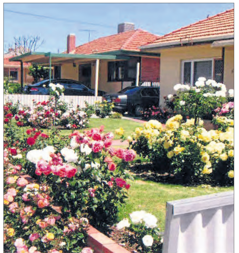
По словам Елены Геннадьевны, сохранить такой сад требует очень много сил и ухода, потому что в засуху ухаживать за розами очень тяжело.