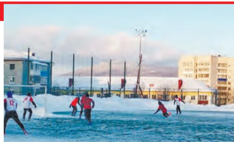
Таблица открытого зимнего первенства г.Качканара по футболу 8x8 на призы главы Качканарского городского округа

Зимний турнир берет большую передышку. Продолжим после Нового года. Всех с наступающими праздниками!