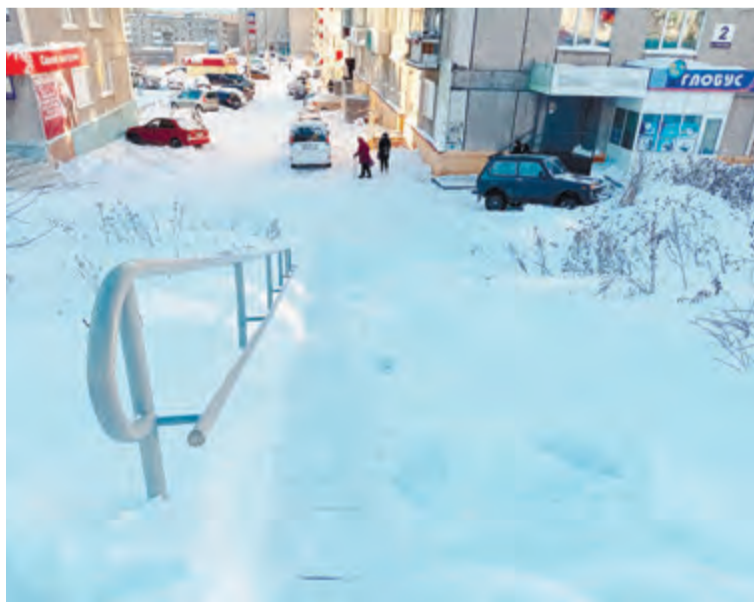
Лестница, ведущая от улицы Гикалова к 11 микрорайону