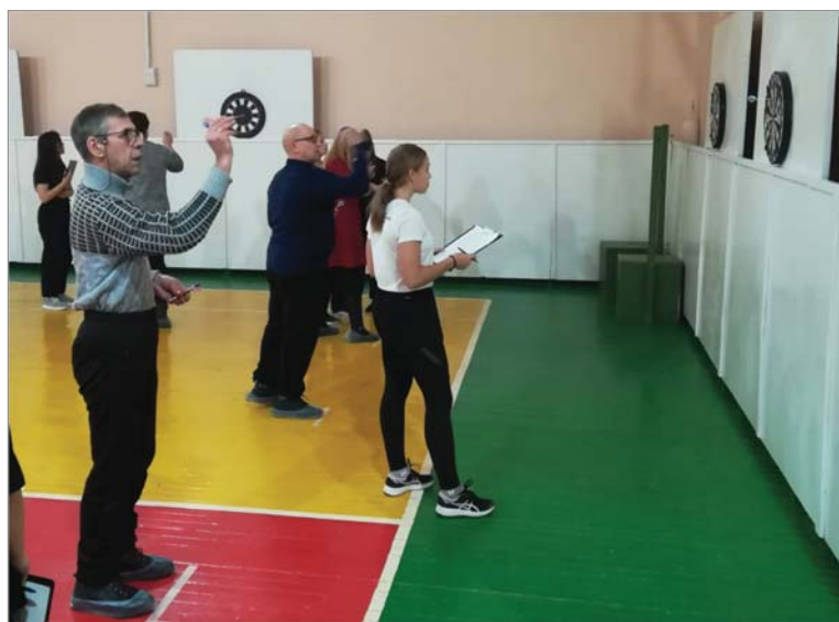
Желающих посоревноваться в меткости всегда много.

Среди вспомогательных подразделений победу одержала сборная РСУ, энергоцеха и СТКиК. На второе место вышла команда рудника, СЗС и ЦЗЛ. «Бронзу»