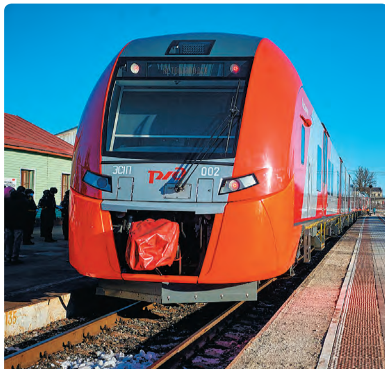
Нынешней осенью началось движение "Ласточек" через Бисерт