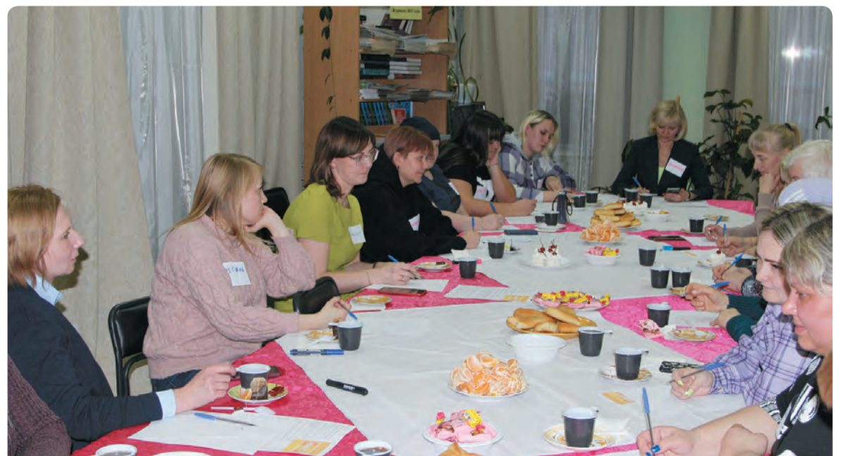
На прошлой неделе в Бисерти состоялся круглый стол, участие в котором принимали семьи мобилизованных бисертцев, местные власти, депутаты, волонтеры, работники Бисертской больницы