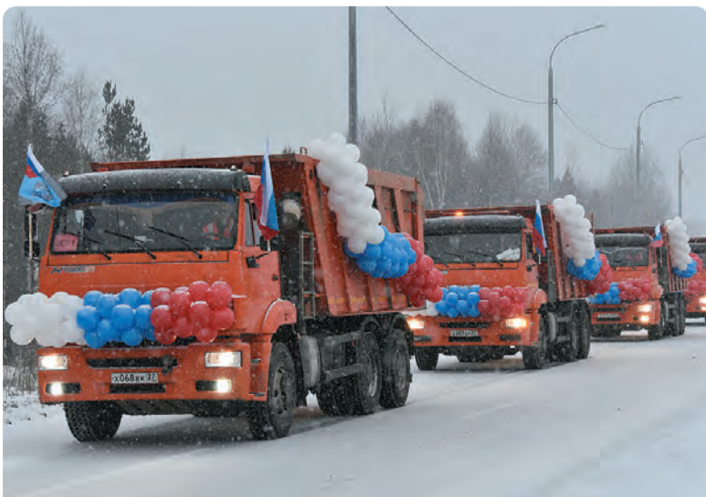
Запуск движения по бисертскому участку федеральной трассы, декабрь 2021 года

Не сомневаюсь, что и новый областной военком, который пришёл работать недавно, тоже обратит внимание на эту проблему.