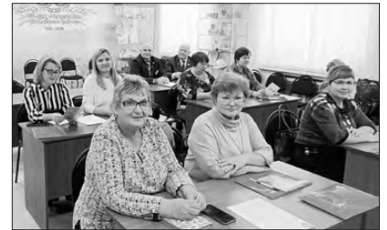
Администрация Каменского городского округа

Посетили гости и Храм Михаила Архангела. В Маминском очень много достопримечательностей, это очень светлое, уютное село, где жители сами делают все, чтобы их малая родина процветала.