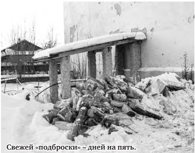
Свежей «подброски» – дней на пять.