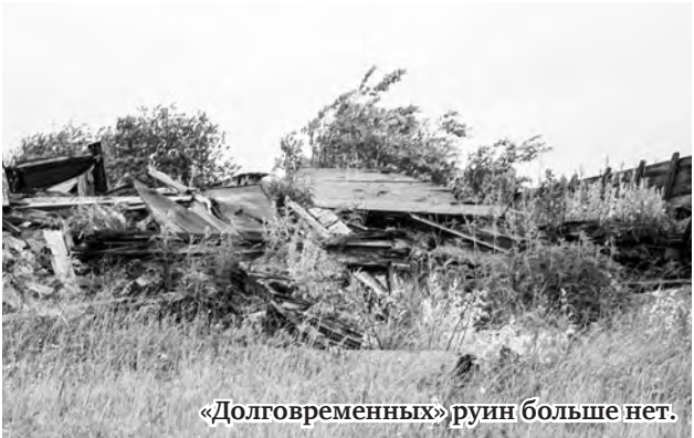
«Долговременных» руин больше нет.

Всего-то пять лет ожидания, три рабочих смены, купе с неоднократными предписаниями прокуратуры, потребовалось для ликвидации свалки руин снесённого в конце 2017 года здания Якшинского дома культуры ввиду его ветхости и непригодности к дальнейшему использованию по назначению.