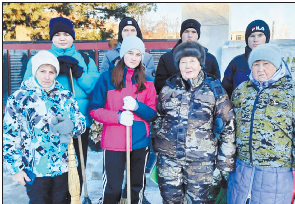
Ветераны завода и ученики школы №1 на субботнике по уборке территории возле обелиска в центре поселка

В районном Совете ветеранов 28 ноября прошло совещание по видеосвязи ZOOM со школами и ветеранскими организациями. На совещании присутствовали 30 представителей организаций. Поднимался вопрос о проведении Дня неизвестного солдата, 3 декабря, и Дня героев Отечества, 9 декабря. Предложено провести 2 декабря совместный субботник по уборке территорий у памятников и обелисков, а в первой декаде декабря организовать сбор заявок по поиску погибших и пропавших без вести воинов во время Великой Отечественной войны.