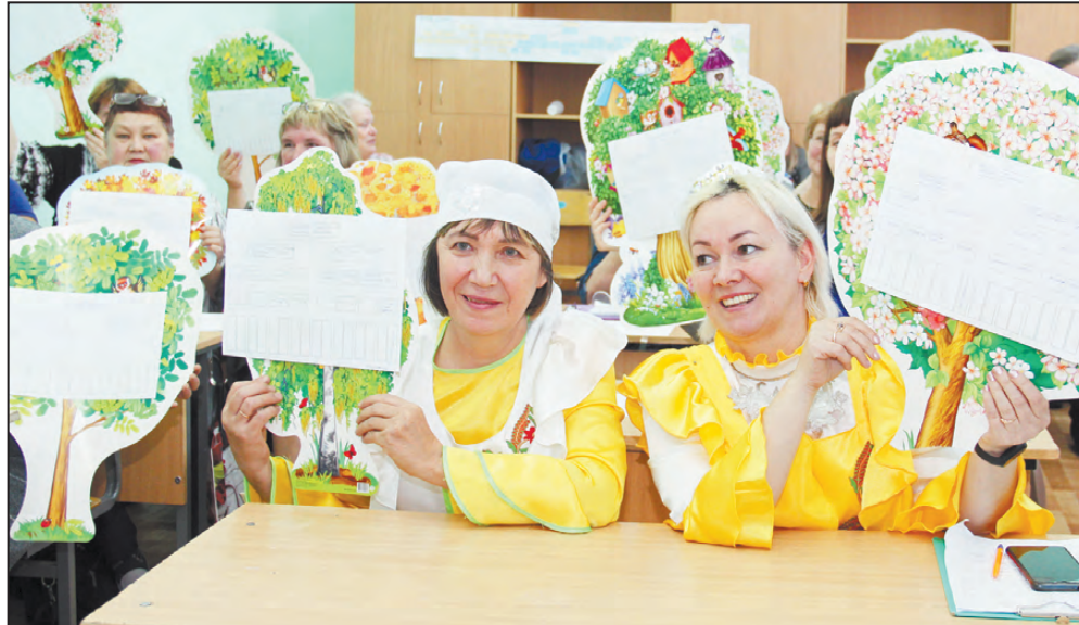
Педагоги школы д. Артя-Шигири