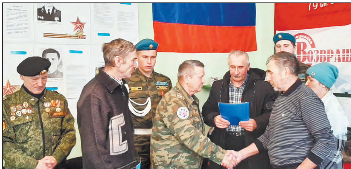
Вручение документов и земли родственникам воинов в Совете ветеранов 3 декабря