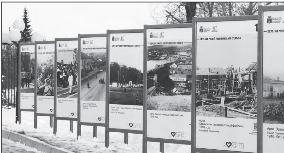
«Земли моей минувшая судьба»